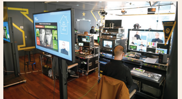
Blick ins Aufnahmestudio im Stadion Wankdorf in Bern.

BERN – Über 1'200 Zahnärztinnen und Zahnärzte sowie 150 Dentalassistentinnen haben die SSO Dental Conference 2021 @ home live verfolgt.