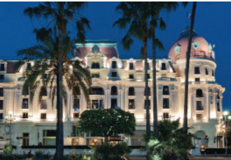
Veranstaltungsort ist das Negresco Hotel Nizza.

American Orthodontics lädt am 10. Dezember nach Nizza.