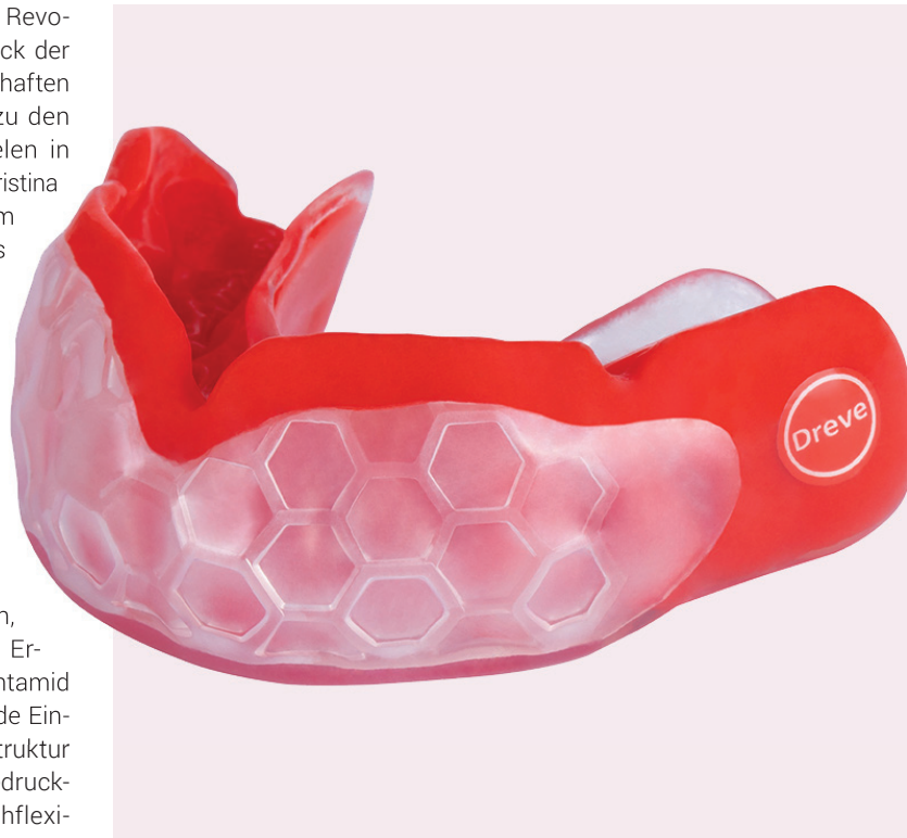
Klein, aber oho: die patentierte Zahnschutzvorrichtung mit digital gedruckter Wabenstruktur des Dreve Mouthguard professional 3D.

Im engen Austausch mit Sportwissenschaftlern und Profisportlern ist es den Materialspezialisten aus Unna gelungen, zwei verschiedene Methoden – die traditionelle Tiefziehtechnik und die digitale Drucktechnik – zu einem Produkt zusammenzuführen, das die bislang erhältlichen Mundschutze in Sachen Schutzwirkung und Tragekomfort übertrifft. Der Dreve Mouthguard professional 3D entspricht damit einer zentralen Arbeitsprämisse bei der Entwicklung neuer Produkte,