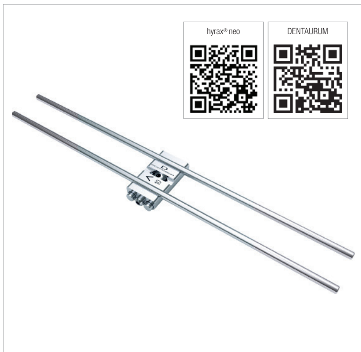
Die neue hyrax® neo von Dentaaurum.

Ab sofort noch größere Auswahl für die schnelle Gaumennahterweiterung mithilfe einer festsitzenden Apparatur.