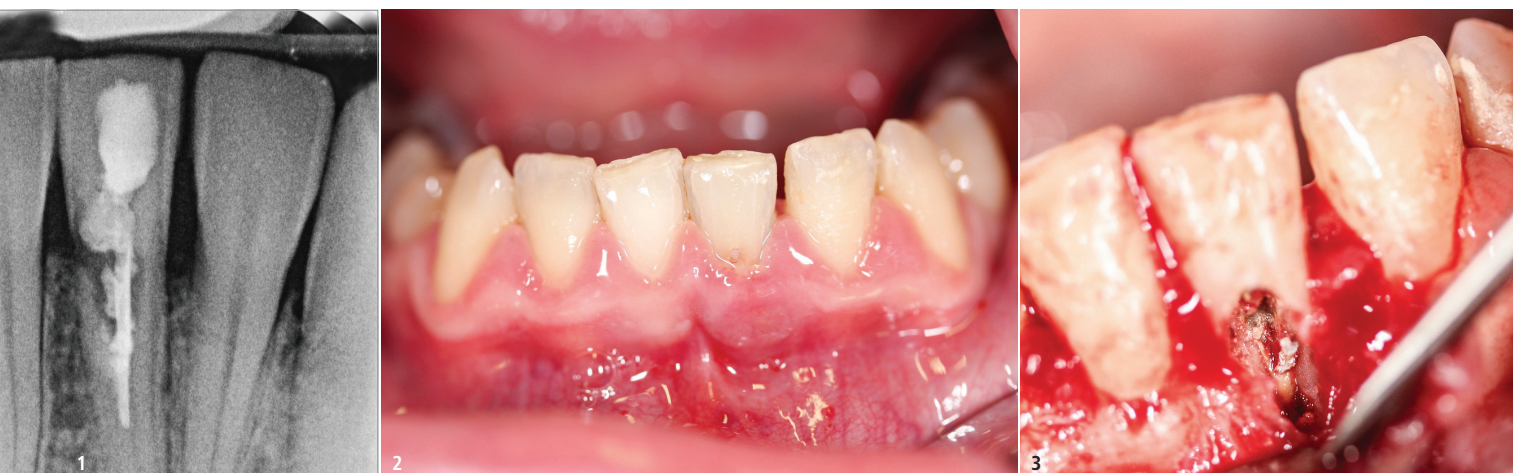
Abb. 1: Alio loco durchgeführte Wurzelkanalbehandlung an Zahn 31, Perforation der Wurzel im vestibulären sowie mesialen Bereich und insuffiziente Wurzelfüllung. – Abb. 2: Zahn 31 mit Schwellung der vestibulären Gingiva. – Abb. 3: Mikrochirurgische Defektdarstellung.

nach vestibulär perforiert, die Wurzelfüllung jedoch anschließend noch inseriert. Röntgenologisch war von einer umfangreichen Perforation nach vestibulär und mesial auszugehen. Die Wurzelfüllung endete im Übergang vom mittleren zum apikalen Wurzeldrittel (Abb. 1). Klinisch zeigte sich eine Fistelung vestibulär sowie eine deutlich erhöhte Sondierungstiefe im Bereich der Perforationsstelle (Abb. 2). Beschwerden hatte der Patient, abgesehen von der Schwellung im marginalen Bereich, nicht. Die kritischen Punkte in diesem Fall waren zum einen der vorliegende Substanzdefekt sowie die daraus resultierende insuffiziente Abdichtung des Wurzelkanalsystems.