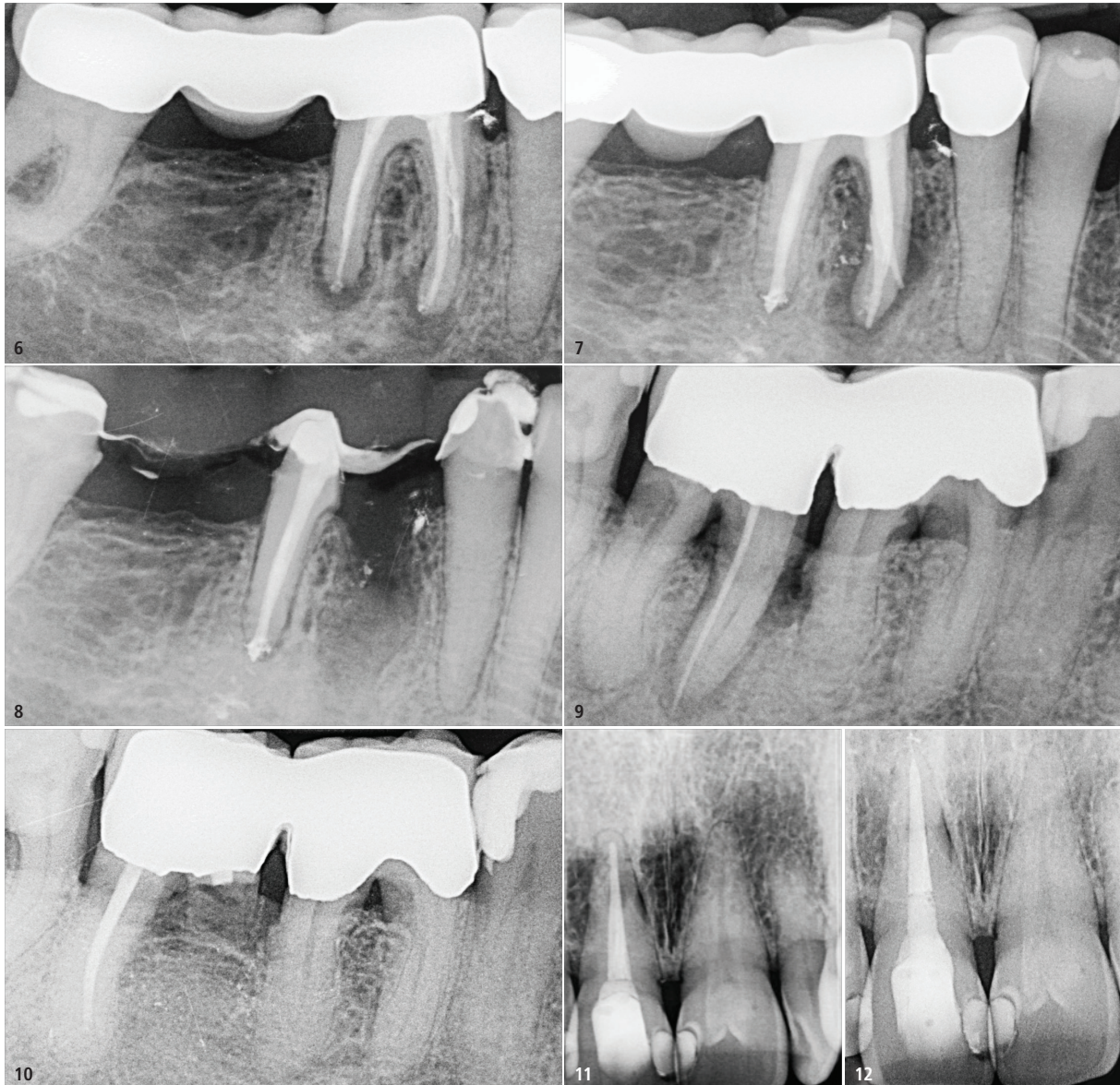
Abb. 6: Apikale Beherdung des Zahns 46 mit V. a. Perforation der mesialen Wurzel. – Abb. 7: Zustand nach der Revision, die apikale Osteolyse der distalen Wurzel ist ausgeheilt. Mesial zeigt sich eine periapikale Osteolyse. – Abb. 8: Zustand nach der Hemisektion und Versorgung mit einer provisorischen Brücke 45–46–48 – Abb. 9: Perforation der mesialen Wurzel Zahn 47 mit periapikaler Aufhellung. – Abb. 10: Zustand nach der Wurzelkanalbehandlung und Hemisektion der mesialen Wurzel. Vollständige Ausheilung mit Regeneration des approximalen Knochens 46/47. – Abb. 11: Alio loco durchgeführte Wurzelfüllung von Zahn 11. – Abb. 12: Röntgenkontrollbild nach Revisionsbehandlung von Zahn 11.