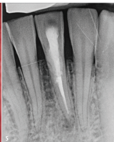
Abb. 4: Deckung der Perforation. – Abb. 5: Röntgenkontrollbild mit Darstellung der suffizienten Perforationsdeckung.