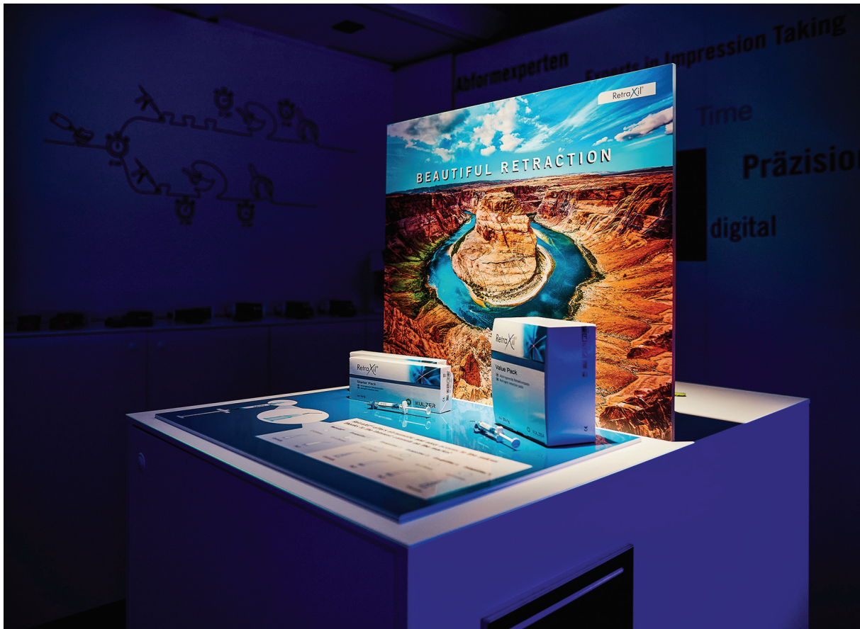
Abb. 2: In der Mobile Academy können Zahnärzte u. a. RetraXil®, die neue Retraktionspaste für analoge und digitale Abdrucktechniken, kennenlernen.

vermittelt wird. Dazu werden in der Erlebniswelt dentale Innovationen und Lösungskonzepte spannend und auch aus ungewohnten Blickwinkeln heraus präsentiert. Die Teilnehmer erhalten bis zu zwei Fortbildungspunkte nach BZÄK und DGZMK.