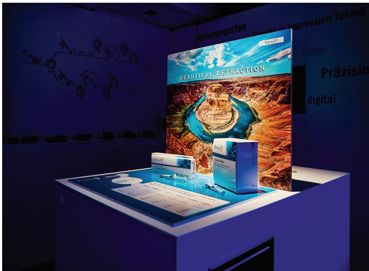
Abb. 2: In der Mobile Academy können Zahnärzte u. a. RetraXil®, die neue Retraktionspaste für analoge und digitale Abdrucktechniken, kennenlernen.

vermittelt wird. Dazu werden in der Erlebniswelt dentale Innovationen und Lösungskonzepte spannend und auch aus ungewohnten Blickwinkeln heraus präsentiert. Die Teilnehmer erhalten bis zu zwei Fortbildungspunkte nach BZÄK und DGZMK.