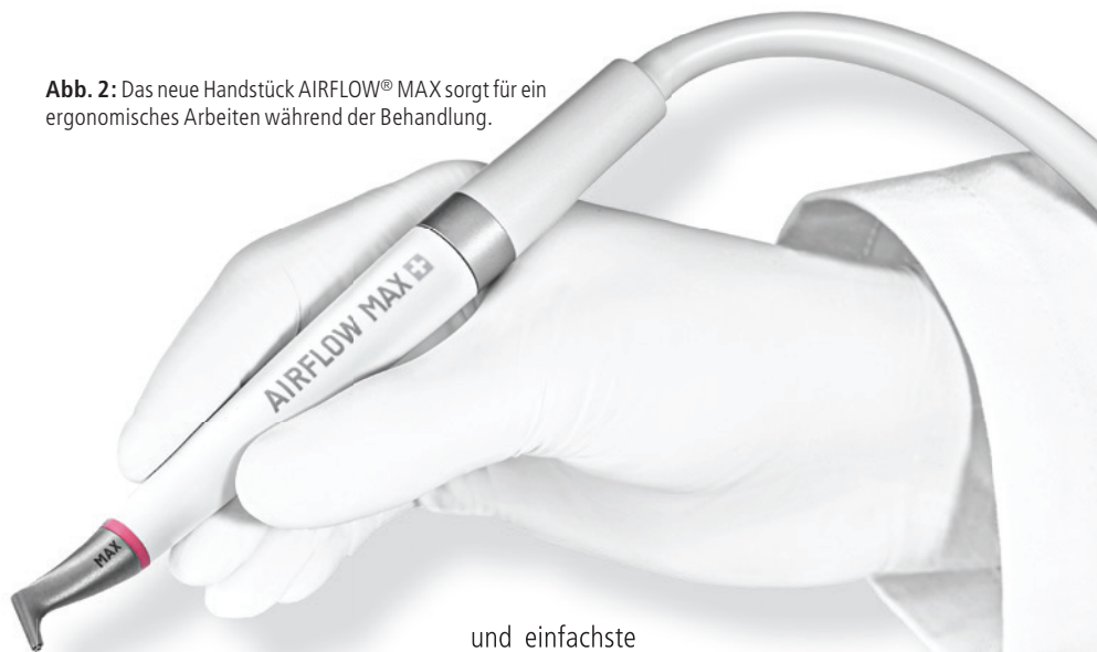
Abb. 2: Das neue Handstück AIRFLOW® MAX sorgt für ein ergonomisches Arbeiten während der Behandlung.

Der neue AIRFLOW® MAX ist ein leichteres, leiseres und ergonomisch optimiertes Handstück mit patentierter Guided Lamina AIRFLOW® Technology (LAT), der neuesten Entwicklung aus dem EMS Research Center. In Verbindung mit AIRFLOW® PLUS Pulver entfernt er besonders effektiv oralen Biofilm supra- und subgingival bis zu 4mm. Das Handstück bietet Behandlern eine verbesserte Sicht und produziert weniger Rückspraynebel. So werden Aerosole um ein Vielfaches reduziert. Bei guter Absaugtechnik ist AIR-FLOWING® in COVID-19-Zeiten damit noch sicherer und wirtschaftlicher geworden. 1