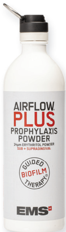
Abb. 1: Das AIRFLOW® PLUS Pulver ist neu in einer hochwertigen Aluminiumflasche erhältlich.

Die moderne Guided Biofilm Therapy (GBT) ist der Gamechanger in der professionellen Prophylaxe – weg vom Kratzen mit Handinstrumenten und abrasiven Pasten, hin zur schonenden, aber effizienten Reinigung mit AIRFLOW® MAX und dem PIEZON® NO PAIN PS Instrument. Klar strukturiertes Vorgehen, hoher Patienten- und Behandlerkomfort und optimale Ergebnisse: GBT ermöglicht Prophylaxe und Parodontaltherapie auf der Basis aktueller wissenschaftlicher Erkenntnisse und einzigartiger Technologien.