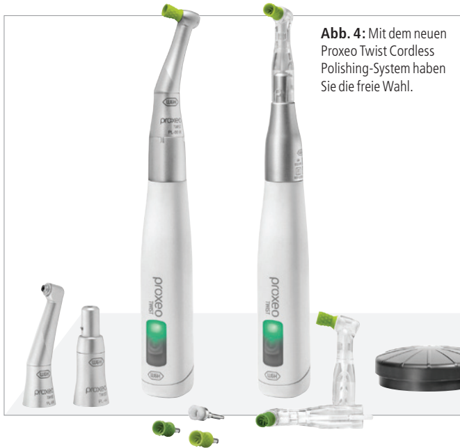
Abb. 4: Mit dem neuen Proxeo Twist Cordless Polishing-System haben Sie die freie Wahl.

Zusätzlich können Sie sich mit der kabellosen Fußsteuerung viel freier bewegen und die Position rund um den Patienten zügig wechseln. Die Geschwindigkeit ist stufenlos von 0 bis 3.000/min regel- und die Drehzahl stets an die klinischen Anforderungen anpassbar. Zudem ist die Fußsteuerung auch mit dem Proxeo Ultra Piezo Scaler PB-530 kompatibel. Damit lässt sich die volle Funktionalität von zwei Geräten nutzen.