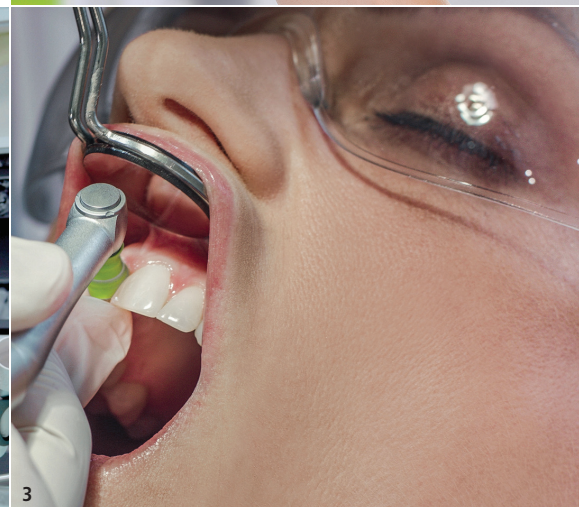
Abb. 1: Proxeo Twist Cordless ist flexibel und kabellos – Ihr Begleiter fürs rotierende Polieren. – Abb. 2: Das neue Proxeo Twist Cordless Polishing-System sorgt für muskelschonendes Polieren und eine rückenfreundliche Haltung. – Abb. 3: Die W&H Prophy-Kelche zeichnen sich durch optimale Adaption und schonende Reinigung bis in den Sulkus aus.

Die Beiträge in dieser Rubrik stammen von den Herstellern bzw. Vertreibern und spiegeln nicht die Meinung der Redaktion wider.