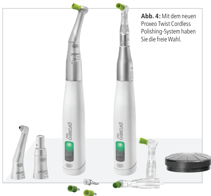
Abb. 4: Mit dem neuen Proxeo Twist Cordless Polishing-System haben Sie die freie Wahl.

Zusätzlich können Sie sich mit der kabellosen Fußsteuerung viel freier bewegen und die Position rund um den Patienten zügig wechseln. Die Geschwindigkeit ist stufenlos von 0 bis 3.000/min regel- und die Drehzahl stets an die klinischen Anforderungen anpassbar. Zudem ist die Fußsteuerung auch mit dem Proxeo Ultra Piezo Scaler PB-530 kompatibel. Damit lässt sich die volle Funktionalität von zwei Geräten nutzen.