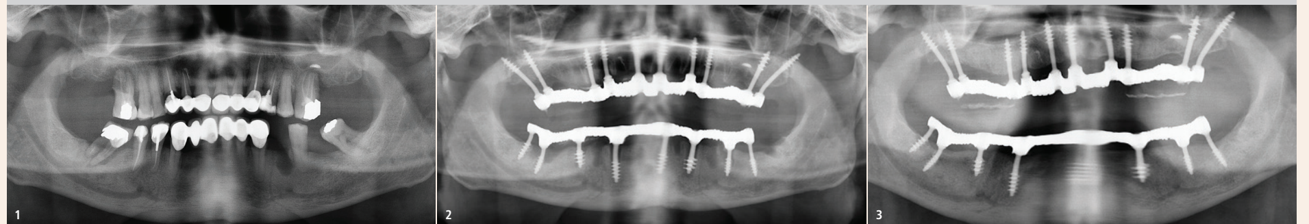
Abb. 1: Präoperatives Panoramabild mit generalisierter Parodontitis und Knochenverlust an allen Zähnen sowie tiefen Endo-Perio-Läsionen an mehreren Zähnen. – Abb. 2: Das nach drei Monaten aufgenommene Panoramabild zeigt, dass alle Zähne extrahiert wurden und dass einige der Implantate in den Extraktionsalveolen (z. B. in den Regionen 47 und 25) und andere in ausgeheilten Knochen eingebracht wurden. – Abb. 3: Das sieben Jahre nach der Behandlung aufgenommene Panoramabild zeigt eine komplikationslose Heilung, das völlige Fehlen von Infektionen und die Bildung einer durchgehenden Knochenlinie der 1. Kortikalis. Es zeigt sich nirgendwo kraterförmiger Knochenverlust. Vielmehr fällt auf, dass sich alle vorbestehenden Knochenkrater (z. B. an parodontal involvierten Zähnen) von alleine wieder aufgefüllt haben, unabhängig von der Implantatinsertion. Das tief in eine parodontal befallene Stelle (in die 2. Kortikalis) eingebrachte Implantat 47 ist nun, nach sieben Jahren, wieder von gesundem Knochen umgeben.