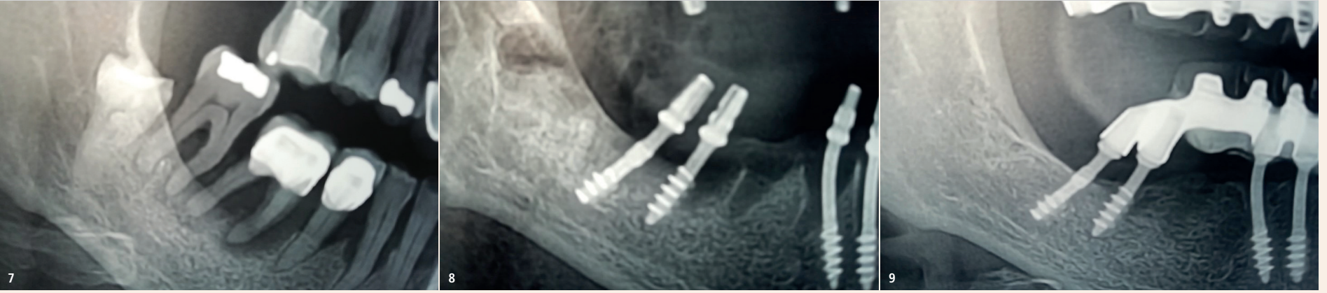
Abb. 7: Panoramaansicht des rechten unteren Unterkiefersegments mit retiniertem Zahn 48 und Zähnen 47, 46, 45, die alle eine ausgeprägte parodontale Schädigung aufweisen. Auch Zahn 44 zeigt fortgeschrittenen Knochenverlust. – Abb. 8: Drei Monate postoperativ lässt sich bereits erkennen, dass alle Extraktionsalveolen in der Heilung begriffen sind: Sie erscheinen kleiner und ihr knöcherner Inhalt zeigt bereits gute Mineralisation. – Abb. 9: Nach zwei Jahren hat sich im rechten Unterkiefer eine neue krestale Knochenlinie gebildet und die ehemaligen Extraktionsalveolen und Taschendefekte haben sich fast komplett eingeebnet.