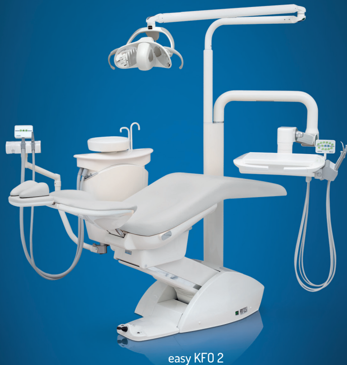
easy KFO 2

Wir gratulieren der Gewinnerpraxis des ZWP Designpreis 2021