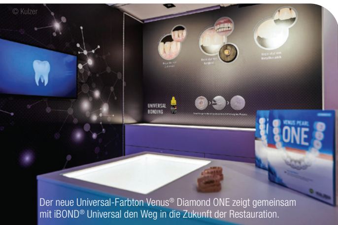
Der neue Universal-Farbtone Venus® Diamond ONE zeigt gemeinsam mit iBOND® Universal den Weg in die Zukunft der Restauration.

Bonding-Systeme lassen sich die Unterschiede nicht mehr überschauen: Ein- und Zwei-Flaschen-systeme? Ist Ätzen möglich oder nicht? Mit welchen Materialien ist mein Adhäsiv kompatibel? Wir bringen Licht ins Dunkel und zeigen, warum iBOND® Universal weit mehr kann als Füllungen auf Gold-standard-Level zu befestigen. Im Bereich der Komposite liegt der Schwerpunkt auf „ONE“, dem neuen Einfarbkonzentrat unserer Hochleistungs-Komposite Venus Diamond und Venus Pearl. Übrigens können die Zahnärzte ONE im Vortrag gleich selbst ausprobieren.