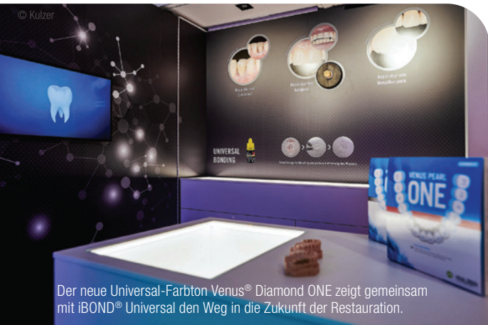
Der neue Universal-Farbtön Venus® Diamond ONE zeigt gemeinsam mit iBOND® Universal den Weg in die Zukunft der Restauration.

Bonding-Systeme lassen sich die Unterschiede nicht mehr überschauen: Ein- und Zwei-Flaschen-systeme? Ist Ätzen möglich oder nicht? Mit welchen Materialien ist mein Adhäsiv kompatibel? Wir bringen Licht ins Dunkel und zeigen, warum iBOND® Universal weit mehr kann als Füllungen auf Gold-standard-Level zu befestigen. Im Bereich der Komposite liegt der Schwerpunkt auf „ONE“, dem neuen Einfarbkonzentrat unserer Hochleistungs-Komposite Venus Diamond und Venus Pearl. Übrigens können die Zahnärzte ONE im Vortrag gleich selbst ausprobieren.