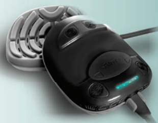
04 Xcentuate: Bedienerunabhängig arbeitende Applikatorplatten für Body Contouring und Hautstraffung an großen Arealen.