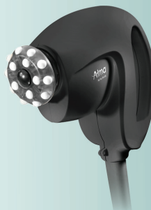
03 UniBody: Intensive UniPolar Radiofrequenz-Technologie mit rotierendem Massagekopf zur Hautstraffung und Cellulite-Therapie.