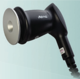
02 UltraWave: Die Ultraschall-Technologie für ein besonders schnelles, effektives Body Contouring.