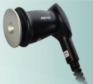
02 UltraWave: Die Ultraschall-Technologie für ein besonders schnelles, effektives Body Contouring.