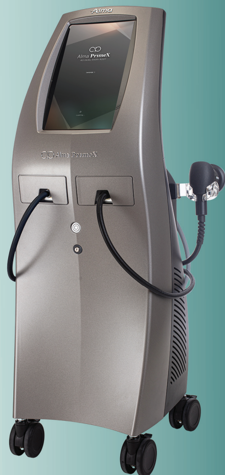
01 Alma PrimeX: Die neue Plattform für Body Contouring und Hautstraffung.

Alma laser · Tel.: +49 911 891129-0 · www.alma-lasers.de