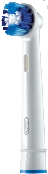
Oral-B Precision Clean Aufsteckbürste

Aufgeklebt, nicht aufgesteckt – auf der letzten Ausgabe des Dentalhygiene Journals prangte die neue Precision Clean Aufsteckbürste von Oral-B. Und so konnte der eine oder andere Leser bereits eine solche Produktprobe testen und selbst feststellen: Die Zahnpflege mit 29 Prozent mehr elastischen Borsten ist sehr viel angenehmer!