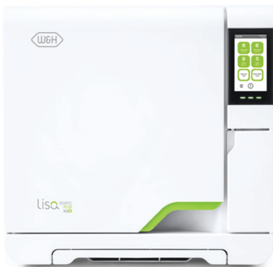
Vorderansicht – Der neue Lisa-Sterilisator ermöglicht mit dem ioDent®-System eine intelligente und vernetzte Instrumentenwiederaufbereitung.