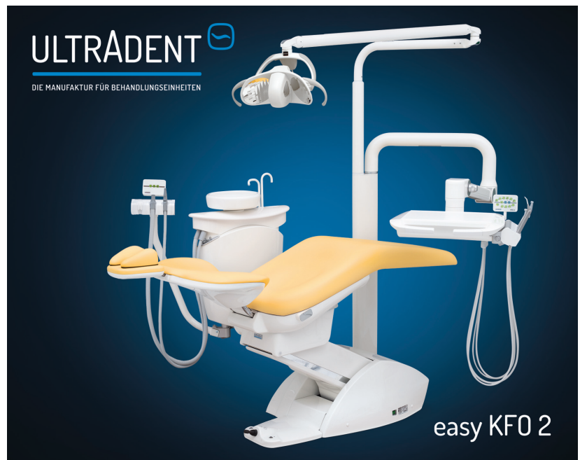
easy KFO 2