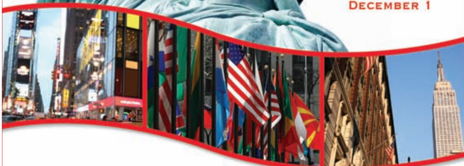
EXHIBIT DATES: NOVEMBER 28 - DECEMBER 1