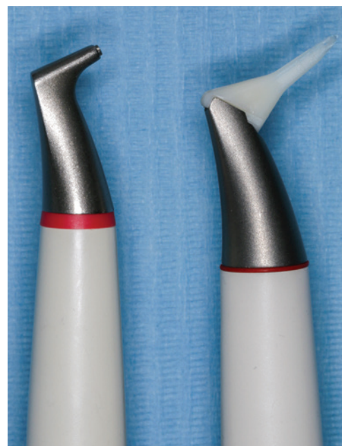
Abb. 6: Handstücke von Luft-Pulver-Wasser-Strahlgeräten für die supra- und subgingivale Anwendung.

Ausschlaggebend für den Erfolg der parodontalen Therapie ist vorrangig die mechanische Entfernung der bakteriellen Beläge, sowohl supra- als auch subgingival. In Ausnahmefällen kann auf ergänzende Chemotherapeutika zurückgegriffen werden. Die S3-Leitlinie kann bei der Auswahl der möglichen Adjuvantien helfen. Durch die neuen GKV-Richtlinien wird der Patient stärker in die Therapie und deren Erfolg durch die Änderung seiner Gewohnheiten