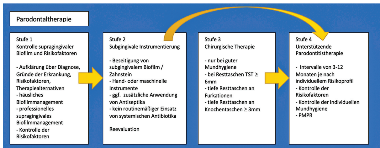
Abb. 1: Stufenkonzept der Parodontistherapie. 1

Im Rahmen der Mundhygieneunterweisung (MHU) wird dem Patienten der Biofilm mithilfe eines Plaquerevelators visualisiert. Anschließend sollte der Patient unter Anleitung diese Beläge selbst entfernen. Zur Belagentfernung werden laut Leitlinie als primäres Hilfsmittel eine Hand- oder elektrische Zahnbürste empfohlen. Zur Interdentalraumreinigung sollten bevorzugt Interdental-