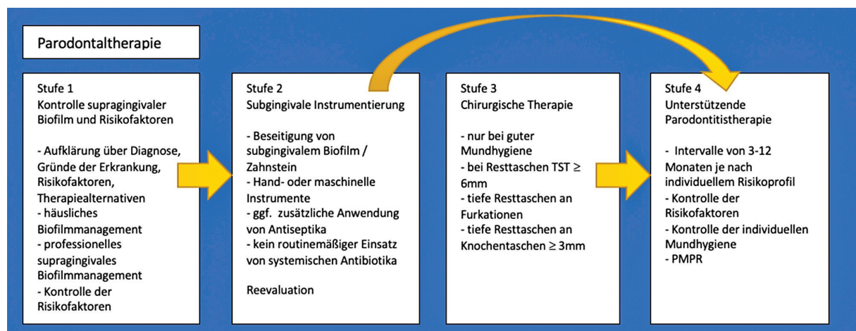
Abb. 1: Stufenkonzept der Parodontistherapie. 1

Im Rahmen der Mundhygieneunterweisung (MHU) wird dem Patienten der Biofilm mithilfe eines Plaquerevelators visualisiert. Anschließend sollte der Patient unter Anleitung diese Beläge selbst entfernen. Zur Belagentfernung werden laut Leitlinie als primäres Hilfsmittel eine Hand- oder elektrische Zahnbürste empfohlen. Zur Interdentalraumreinigung sollten bevorzugt Interdental-