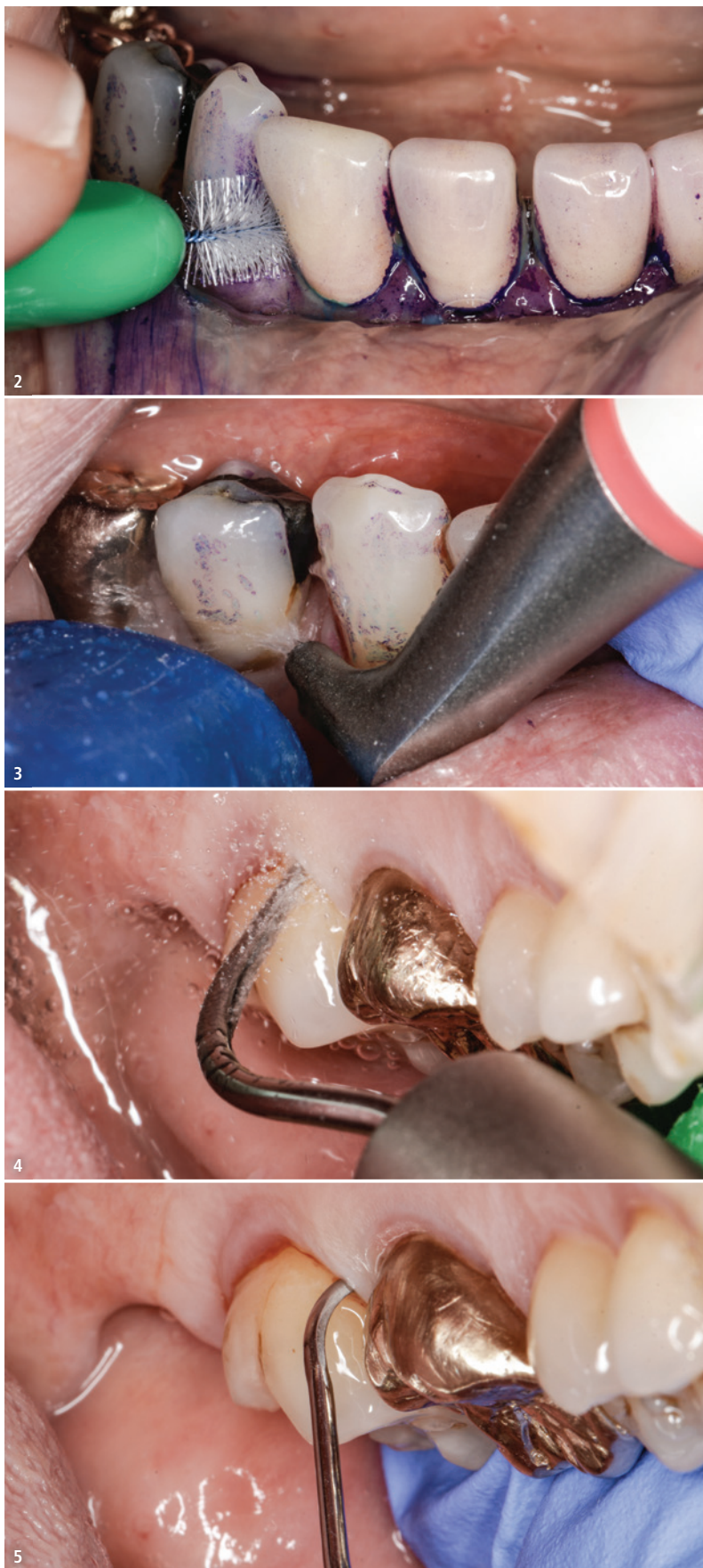
Abb. 2: Praktisches Training häusliche Mundhygiene durch den Patienten. – Abb. 3: Anwendung eines Luft-Pulver-Wasser-Strahlgeräts. – Abb. 4: Subgingivale Instrumentierung mit maschinellen Instrumenten (hier: Airscaler). – Abb. 5: Subgingivale Instrumentierung mit Handinstrumenten.

sowie taktiles Geschick des Behandlers. Bei richtiger Anwendung bringen sie – im Vergleich zu Handinstrumenten – eine erhebliche Arbeitserleichterung (Schonung von Sehnen und Gelenken) und evtl. auch Zeitersparnis mit sich. 7 Das zeitaufwendige und techniksensitive Schärfen der Instrumente entfällt. Zum Einsatz kommen Schall- und Ultraschallgeräte mit den vom Hersteller zugelassenen Subgingivalansätzen (Abb. 4), um eine ausreichende Kühlung der Arbeitsspitze auch in der Tasche zu gewährleisten. Da bei allen Geräten nur die vorderen 1–2 mm der Arbeitsspitzen aktiv Biofilm und harte Auflagerungen abtragen, sollten diese regelmäßig kontrolliert (Prüfkarten) und ausgetauscht werden.