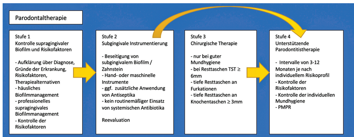
Abb. 1: Stufenkonzept der Parodontistherapie. 1

Im Rahmen der Mundhygieneunterweisung (MHU) wird dem Patienten der Biofilm mithilfe eines Plaquerevelators visualisiert. Anschließend sollte der Patient unter Anleitung diese Beläge selbst entfernen. Zur Belagentfernung werden laut Leitlinie als primäres Hilfsmittel eine Hand- oder elektrische Zahnbürste empfohlen. Zur Interdentalraumreinigung sollten bevorzugt Interdental-