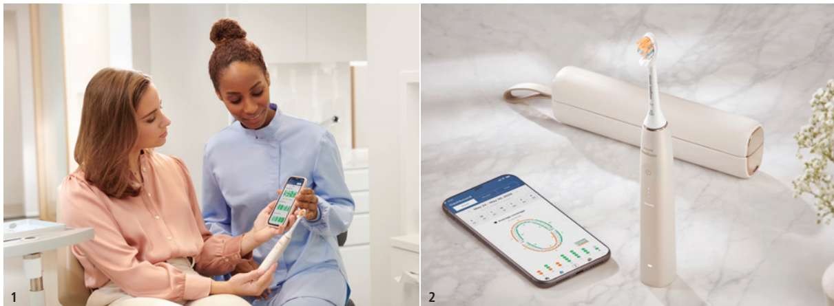
Abb. 1: In der Praxis kann die zahnmedizinische Assistenz Patient*innen die Anwendung der Schallzahnbürste Philips Sonicare 9900 Prestige und der dazugehörigen App erläutern. – Abb. 2: Die Philips Sonicare 9900 Prestige ist auch mit einer passenden App nutzbar.

Eine Gemeinsamkeit bei vielen Patient*innen ist häufig, dass sie nach Lösungen suchen, die effizient die Zähne reinigen, sanft zu Hart- und Weichgewebe und darüber hinaus durch eine simple Putztechnik einfach richtig anzuwenden sind. In diesen Punkten überzeugen elektrische Zahnbürsten mit der innovativen Schalltechnologie von Philips Sonicare. Diese bieten gegenüber der Handzahnbürste sowohl einen statistisch signifikant größeren Effekt bei der Reduktion von Gingivitis als auch eine bis zu 20-mal bessere Plaqueentfernung. 1,2