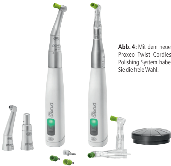
Abb. 4: Mit dem neuen Proxeo Twist Cordless Polishing System haben Sie die freie Wahl.

muss. Das Fußpedal hat keine Akku-Anzeige. Ich würde es bevorzugen, wenn das Handstück eine Batterieanzeige mit Strichcode hätte, sodass ich dauerhaft einen Gesamtüberblick der Kapazität habe und mich nicht darauf konzentrieren muss, wann der Farbwechsel die Akkuleistung anzeigt. Die Anzeige in Form eines Strichcodes wäre ebenso von Vorteil, wenn das Polishing-System im Praxisalltag anwenderübergreifend eingesetzt wird.