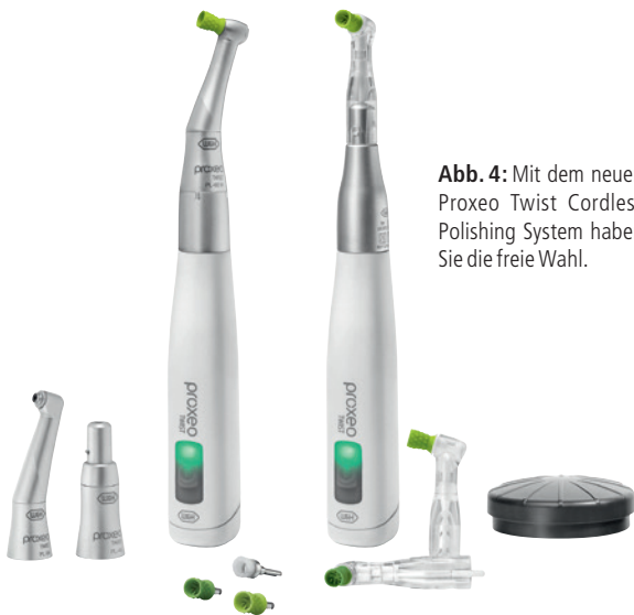
Abb. 4: Mit dem neuen Proxeo Twist Cordless Polishing System haben Sie die freie Wahl.

muss. Das Fußpedal hat keine Akku-Anzeige. Ich würde es bevorzugen, wenn das Handstück eine Batterieanzeige mit Strichcode hätte, sodass ich dauerhaft einen Gesamtüberblick der Kapazität habe und mich nicht darauf konzentrieren muss, wann der Farbwechsel die Akkuleistung anzeigt. Die Anzeige in Form eines Strichcodes wäre ebenso von Vorteil, wenn das Polishing-System im Praxisalltag anwenderübergreifend eingesetzt wird.