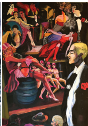
H. Behrbohm, aus dem Zyklus Atlantic Affairs, Acryl/LW, 2019, 100 x 80 cm

Mit einer Vernissage und einem Talk wird zu Beginn des Kongresses eine Ausstellung im Hotel NEPTUN mit Bildern des HNO-Arztes und Künstlers Prof. Dr. Dr. h.c. Hans Behrbohm eröffnet.