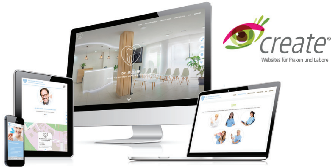
Neues Feature beim create® Website Service von Dentaforum: Moderne OnePager. (@DENTAURUM)

Ab sofort sind im Serviceangebot der create® Websites auch die beliebten OnePager, also Internetauftritte, die sich auf nur einer einzelnen Seite abspielen, zu finden. Modern gestaltete übersichtliche und flexible Layouts bieten Behandlern die Möglichkeit, alle Praxisleistungen, Einblicke und Kontaktinformationen aufzuführen. Auf nur einer Seite, mit nur einem Blick sowie höchstem Komfort und Service für ihre Patienten. Eine praktische Online-Visitenkarte im Website-Design.