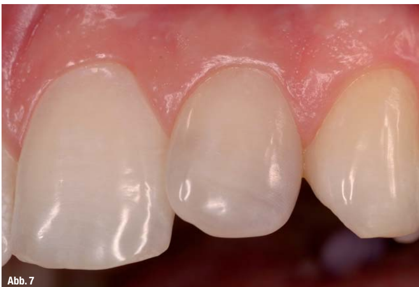
Abb. 7 Endsituation nach Ausarbeitung und Politur.

mern. Die Bleichtherapie bietet hier umfangreiche Möglichkeiten, das Erscheinungsbild der Zähne zu verbessern. 1 Allerdings kommt immer wieder die Frage auf, welche Nebenwirkungen mit der Bleichtherapie verbunden sind. 2 Neben Hypersensibilitäten und Schädigungen oraler Strukturen wird in der Literatur der Einfluss der Bleichtherapie auf die Haltekraft adhäsiver Restaurationen diskutiert. Dieser Aspekt wird in zahlreichen Studien beleuchtet und zeigt durchaus interessante Ergebnisse. Jedoch muss beachtet werden, dass sich eine Vielzahl der Studien lediglich mit Mikrohärteveränderungen und Haftkraftverlusten von adhäsiven Restaurationen am Zahnschmelz beschäftigen. 3 Jedoch kommt in der Praxis nicht ausschließlich Schmelz mit Bleichmitteln in Kontakt, sondern auch Dentin kann kontaminiert werden. Dieser Beitrag soll einen Überblick über die Thematik geben und in Kombination mit einem Fallbericht erste Ergebnisse einer In-vitro-Untersuchung aus unserer Abteilung vorstellen.