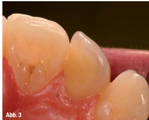
Abb. 3 Ansicht von palatinal.

Bei Wasserstoffperoxidgelen mit Konzentrationen von 30–38 %, welche nur für die Anwendung in der Zahnarztpraxis bestimmt (In-Office) und zusätzlich durch Licht oder Wärme aktivierbar sind, konnten Autoren eine Erhöhung der Pulpatemperatur von 5 °C bis 8 °C nachweisen, was möglicherweise Risiken