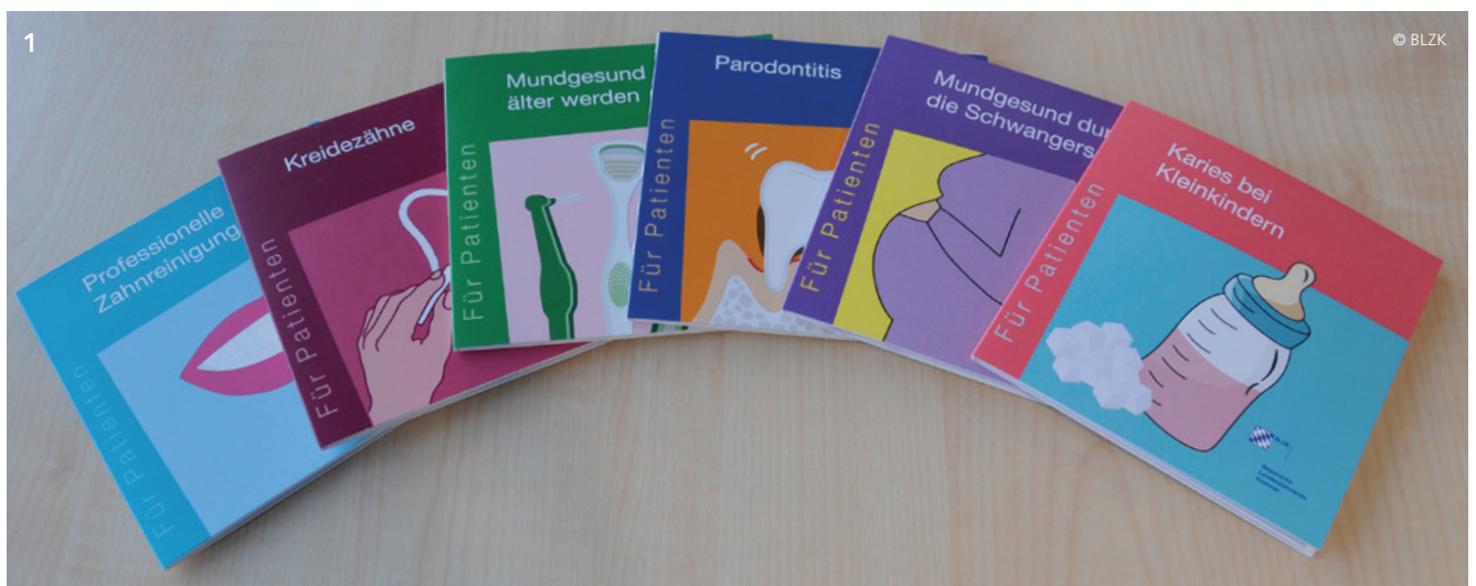
Abb. 1: Die Pockets sind sowohl einzeln als auch im Paket erhältlich.

Kürzlich ist das siebte Pocket erschienen – zum Thema „Zähne und Allgemeingesundheit“. Patientinnen und Patienten erfahren darin, wie die Mundgesundheits die Allgemeingesundheit beeinflusst und warum es vor allem zwischen der Parodontitis und bestimmten Erkrankungen Wech-