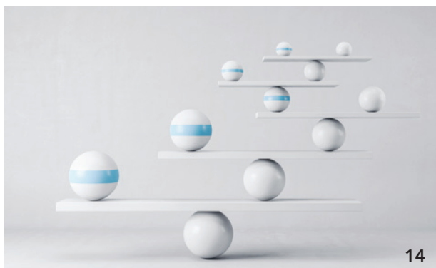
Privatabrechnungen in Zahnarztpraxen bei 48 Prozent