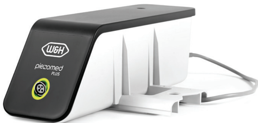
Abb. 1: Das Piezomed Plus Modul eröffnet neue Perspektiven in der Behandlung.

Das neue Piezomed Modul von W&H ist DER Gamechanger in der Piezochirurgie! Als einfache Add-on-Lösung kann es mit Implantmed Plus kombiniert werden und erfüllt damit den Wunsch nach einem vollständig integrierten Workflow. Einfach und kostengünstig lässt sich der Implantologiemotor mit dem neuen Modul nachrüsten. Das kombiniert Implantologie und Piezochirurgie in einem Gerät. Gekoppelt mit den Funktionalitäten der Implan-