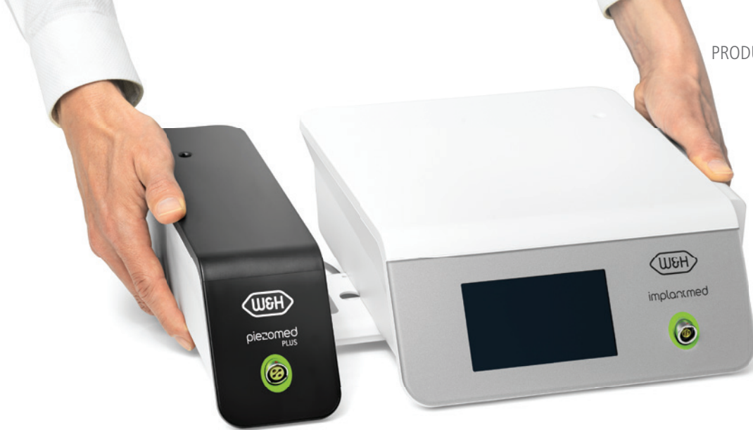
Abb. 2: Das neue Piezomed Modul: Ein wichtiger Baustein, der bisher am Markt gefehlt hat. – Abb. 3: Das Piezomed Classic Modul ist DAS Tool für den allgemeinen zahnärztlichen Gebrauch. – Abb. 4: Das neue modulare System von W&H vereinfacht den Chirurgie-Workflow.

tatstabilitätsmessung und Dokumentation deckt W&H als erster Hersteller den gesamten Chirurgie-Workflow ab. Oralchirurgen dürfen sich also auf neue Möglichkeiten in der Behandlung freuen.