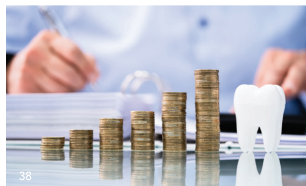
Unternehmen Zahnarztpraxis: Betriebsübergang bei Praxisübernahme