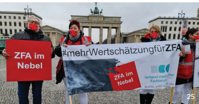
Der Kontakt zum Nachwuchs ist der KZVB ein großes Anliegen.