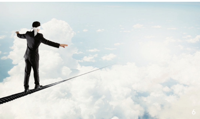
Ein schweres Erbe für Karl Lauterbach