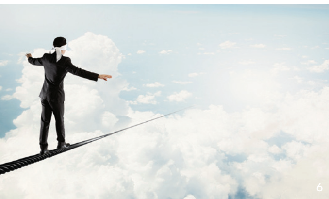
Ein schweres Erbe für Karl Lauterbach