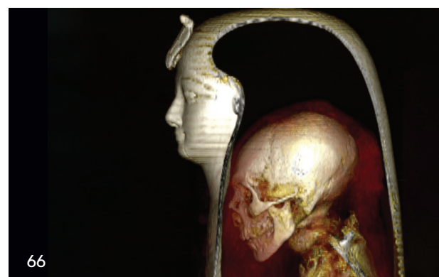
Mumienforscher auf den Spuren oraler Mikroorganismen

Die Herausgeber sind nicht für den Inhalt von Beilagen verantwortlich.