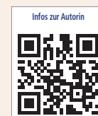
Infos zur Autorin

IWB CONSULTING Hoppegarten 56 59872 Meschede Deutschland Tel.: +49 174 3102996 www.iwb-consulting.info