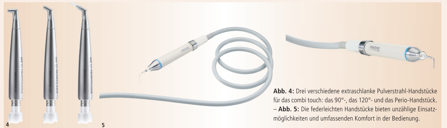
Abb. 4: Drei verschiedene extraschlanke Pulverstrahl-Handstücke für das combi touch: das 90°-, das 120°- und das Perio-Handstück. – Abb. 5: Die federleichten Handstücke bieten unzählige Einsatzmöglichkeiten und umfassenden Komfort in der Bedienung.