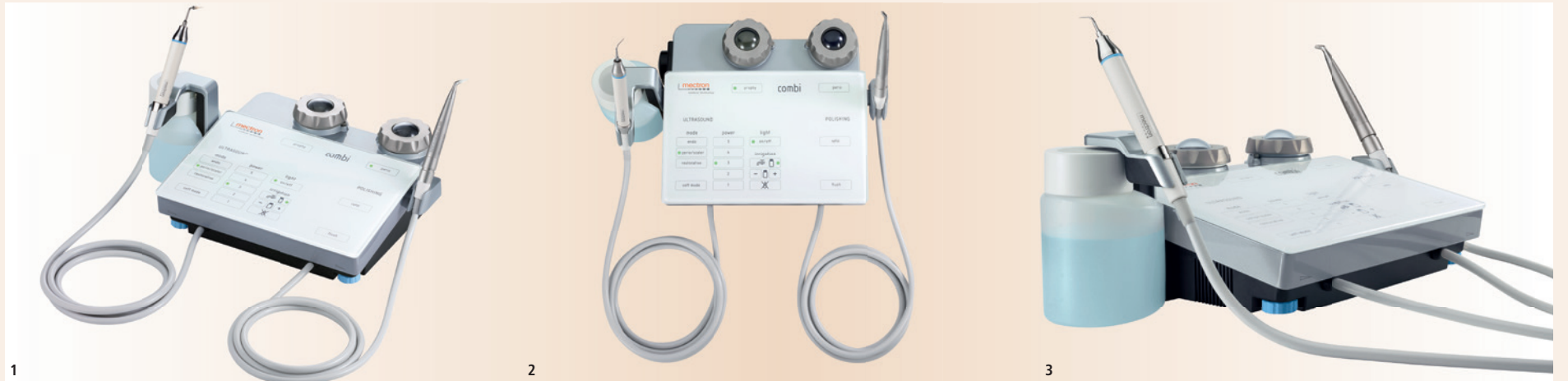
Abb. 1: Das combi touch von mectron kombiniert Ultraschalleinheit und Pulverstrahlgerät miteinander. – Abb. 2: Ein einfaches Drücken der Prophy- oder Perio-Taste auf dem Touchscreen genügt, um während der Behandlung zwischen supra- und subgingivalem Air-Polishing zu wechseln. – Abb. 3: Das combi touch verfügt über zwei Spülleitungen für das Ultraschallsystem.

Einfach unentbehrlich: Das neue, verbesserte combi touch von mectron.