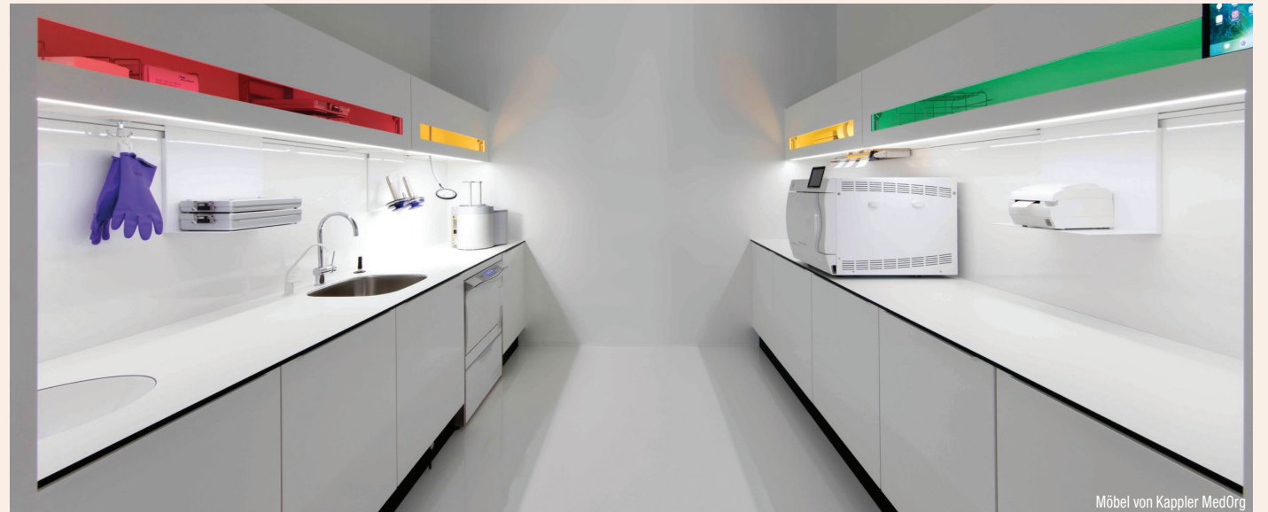
Möbel von Kappler MedOrg

Ganz klar: Der Schutz von Personal und Patienten steht an erster Stelle. Ein sauberes Hygienekonzept gibt Ihrem Team die Gewissheit, in einer sicheren Umgebung zu arbeiten, und sorgt für ein entspanntes Miteinander in der Praxis – ein nicht zu unterschätzender Wert bei Tätigkeiten, die so nah am Patienten verrichtet werden. Auch bei den Patienten kann so gepunktet werden, denn diese bemerken bereits beim Betreten der Praxis, dass an alles gedacht wurde, und fühlen sich gut aufgehoben. Hier kommt Zeit als relevanter Faktor ins