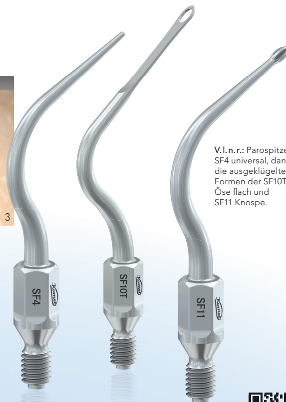
Abb. 2 und 3: Das sechsfach verzahnte Arbeitsteil der SF11 (Knospe) erlaubt ein effektives Reinigen besonders schwer zugänglicher Bereiche, z. B. der Furkation. Durch ihre individuelle Form passt sie sich einer Vielzahl von Dachgeometrien an.

V.l.n.r.: Parospitze SF4 universal, daneben die ausgeklügelten Formen der SF10T Öse flach und SF11 Knospe.