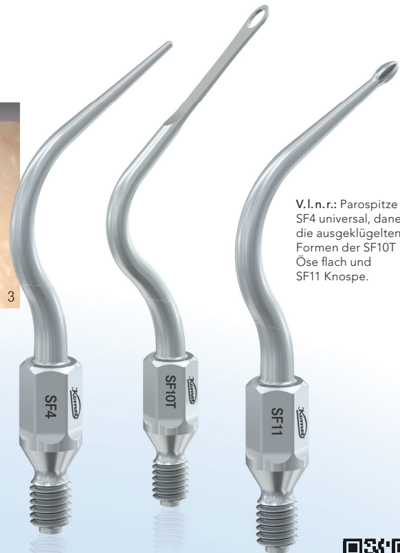
Abb. 2 und 3: Das sechsfach verzahnte Arbeitsteil der SF11 (Knospe) erlaubt ein effektives Reinigen besonders schwer zugänglicher Bereiche, z. B. der Furkation. Durch ihre individuelle Form passt sie sich einer Vielzahl von Dachgeometrien an.

V.l.n.r.: Parospitze SF4 universal, daneben die ausgeklügelten Formen der SF10T Öse flach und SF11 Knospe.