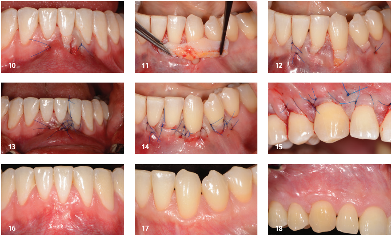
Abb. 10: Das Transplantat wurde in den Tunnel gezogen und mittels Umschlingungsnahten über die Rezession am Zahn 31 befestigt (Fall aus Abb. 1, 4, 5 und 8). – Abb. 11: Ein ausreichend langes und breites SBTG unterstützt die Papillen und verdickt das bukkale Weichgewebe (Fall aus Abb. 2, 6, 7 und 9). – Abb. 12: Das Transplantat wurde in den Tunnel gezogen und mittels Umschlingungsnahten über die Rezessionen an den Zähnen 32, 33 und 44 fixiert (Fall aus Abb. 2, 6, 7, 9 und 11). – Abb. 13: Spannungsfreie laterale Schließung der Rezession und des Transplantats am Zahn 31 (Fall aus Abb. 1, 4, 5, 8 und 10). – Abb. 14: Spannungsfreie Deckung der Rezessionen und des Transplantats an den Zähnen 32, 33 und 44 mittels Umschlingungsnahten (Fall aus Abb. 2, 6, 7, 9, 11 und 12). – Abb. 15: Spannungsfreie Deckung der Rezessionen und des Transplantats an den Zähnen 13, 14 und 15 mittels Umschlingungsnahten (Fall aus Abb. 3). – Abb. 16: Ein Jahr nach Therapie sind eine gute Wurzeldeckung sowie eine optimale Farbe und Verdickung ersichtlich (siehe Anfangsbild von Abb. 1). – Abb. 17: Klinisches Ergebnis ein Jahr nach der Therapie der in Abb. 2 abgebildeten Rezessionen. Eine hervorragende Wurzeldeckung und eine natürliche Farbe und Verdickung konnten erreicht werden. – Abb. 18: Klinisches Ergebnis fünf Jahre nach der Therapie der in Abb. 3 abgebildeten Rezessionen. Eine langzeitstabile, komplette Wurzeldeckung mit einer natürlichen Farbe wurde erreicht.

nen Zeitraum von fünf bis zehn Jahren (Abb. 18).