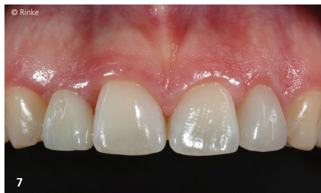
Abb. 6 und 7: Oft verzichtbar, in Einzelfällen aber wichtig ist die volladhäsive Befestigung einer prothetischen Restauration aus Zirkonoxid, hier: Adhäsivbrücke zum Lückenschluss Regio 12 (12-21) – zahntechnische Arbeit, bereit zum Einsetzen (oben) und eingegliedert im Mund des Patienten (unten).