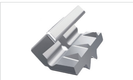
Shark Stops