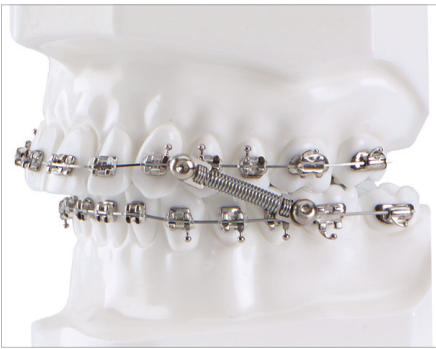
CS5 Klasse II-/III-Feder

Auf Greiner Orthodontics ist auch in herausfordernden Zeiten stets Verlass.