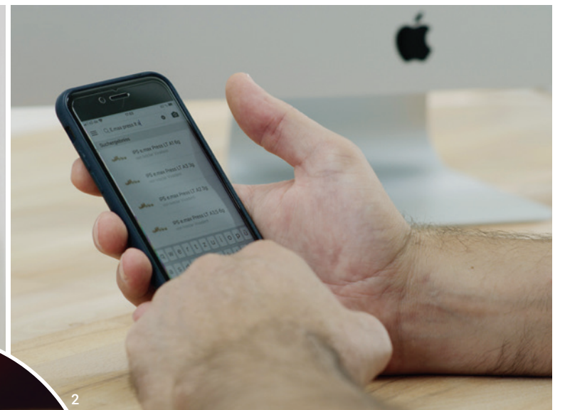
Abb. 1: Der Bestellvorgang kann jederzeit schnell und einfach per Stichwortsuche vorgenommen werden. Abb. 2: Die AERA-Online Bestellplattform funktioniert auch problemlos auf mobilen Endgeräten. Abb. 3: Stefan Nell ist spezialisiert auf die Herstellung von natürlichem Zahnersatz.

AERA ist Bestellen ohne Wartemusik. Einfach klicken und das Thema ist erledigt, nicht auf eins und zwei drücken und dann steckt man ewig in der Warteschleife. Nein, einfach klicken, bestellen und fertig.