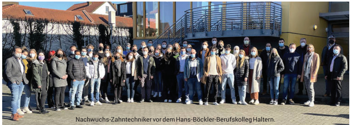
Nachwuchs-Zahntechniker vor dem Hans-Böckler-Berufskolleg Haltern.