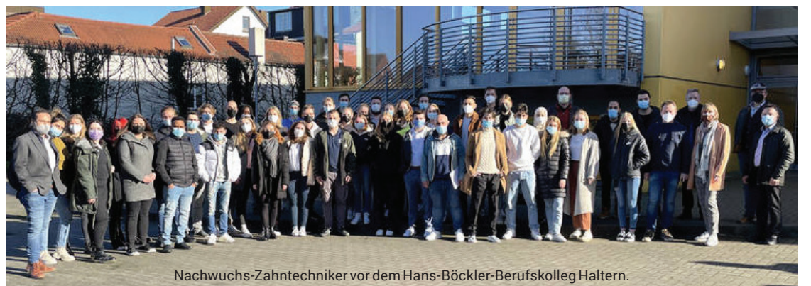
Nachwuchs-Zahntechniker vor dem Hans-Böckler-Berufskolleg Haltern.