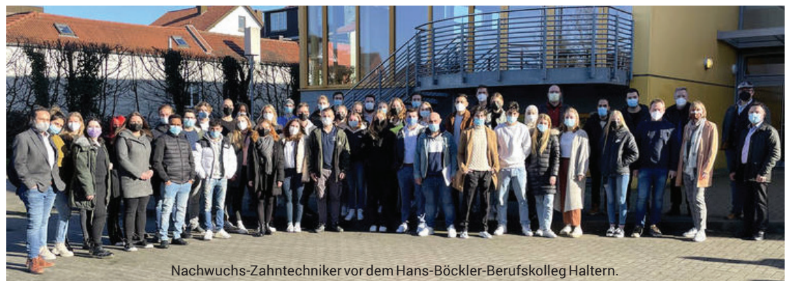
Nachwuchs-Zahntechniker vor dem Hans-Böckler-Berufskolleg Haltern.