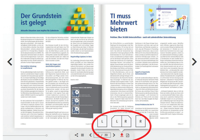
Abb. 2: Über den Download-Pfeil im Menü unten können Sie auswählen, ob Sie die linke, rechte oder die Doppelseite als PDF downloaden wollen.