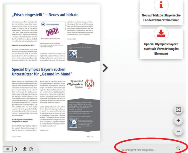
Abb. 3: Rechts unten können Sie neben der Lupe Keywords für Ihre Suche eingeben. Über die angezeigten Links neben der Seite im E-Paper gelangen Sie direkt zu weiteren Informationen.