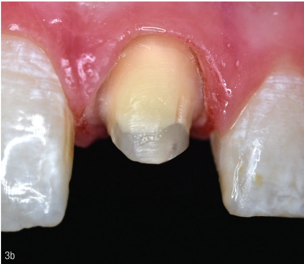
Abb. 3a und b: Vorbehandlung des Zahnes 21 und Stiftaufbau (GC Gradia Core).