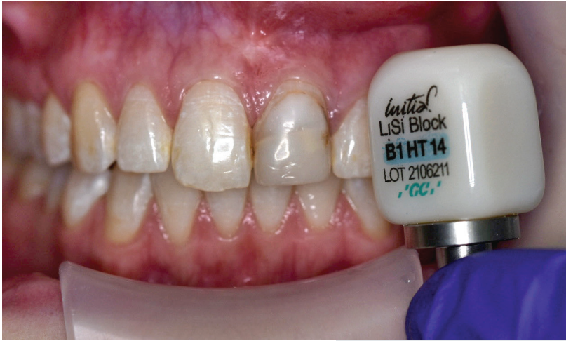
Abb. 2: Material der Wahl: Die vollständig kristallisierte CAD/CAM-Keramik GC Initial LiSi Block.

Soll auf einen Kristallisationsbrand verzichtet werden, war die Werkstoffauswahl bislang beschränkt auf Hybridkeramiken sowie Glaskeramiken. Alternativen waren Hochleistungskomposite, sogenannte Hybridkeramiken. Neu in diesem Umfeld ist nun die erste vollständig kristallisierte Lithium-Disilikat-Keramik Initial LiSi Block (GC). Dieser CAD/CAM-Keramikkblock basiert auf der bewährten HDM-Technologie (High Density Micronization). Die ultrafeinen Kristalle vereinfachen das Schleifen der Keramik, sodass Initial LiSi Block im vollkristallisierten Stadium geschliffen wird. Der Kristallisationsbrand entfällt, was deutlich Zeit einspart. Da kein Kristallisationsbrand notwendig ist, beeindruckten Restaurationen aus Initial LiSi Block selbst bei dünnen Rändern sehr passgenau und weisen eine hohe Kantenstabilität auf. Damit ist es möglich, auch im Frontzahnbereich vollkeramische Restaurationen als harmonisches Pendant zum Nachbarzahn zu fertigen.