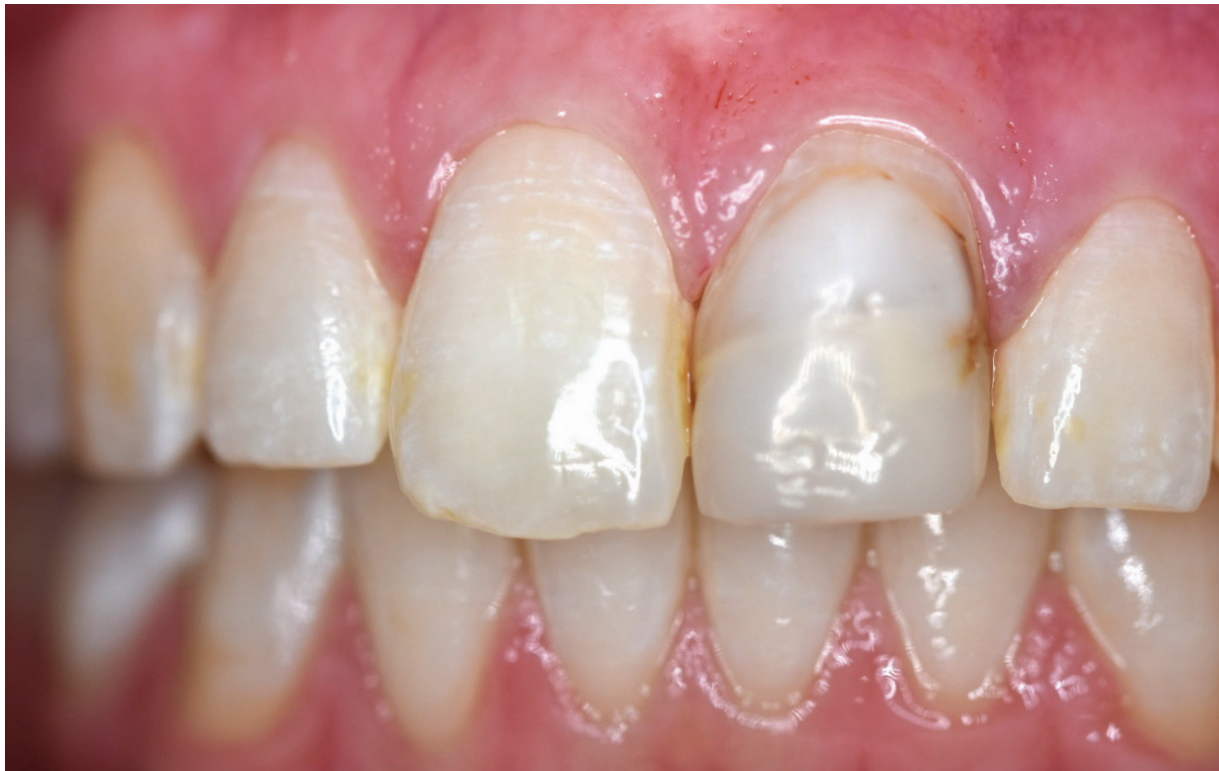
Abb. 1: Zahn 21 soll mit einer Vollkeramikkrone – Single-Visit – versorgt werden.

KERAMIK /// Der Patientenwunsch nach einer schnellen und ästhetischen Restauration nimmt immer mehr zu. Viele Patienten sind gut informiert und wissen um die Möglichkeiten der Digitalen Zahnheilkunde beziehungsweise der Chairside-Behandlung. Für das Herstellen einer Single-Visit-Restauration gibt es verschiedene Werkstoffe. Im folgenden Beitrag wird die Restauration mittels des vollständig kristallisierten CAD/CAM-Blocks aus Lithium-Disilikat Initial™ LiSi Block (GC) anhand eines Patientenfalls vorgestellt.