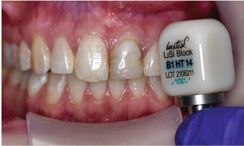
Abb. 2: Material der Wahl: Die vollständig kristallisierte CAD/CAM-Keramik GC Initial LiSi Block.

Soll auf einen Kristallisationsbrand verzichtet werden, war die Werkstoffauswahl bislang beschränkt auf Hybridkeramiken sowie Glaskeramiken. Alternativen waren Hochleistungskomposite, sogenannte Hybridkeramiken. Neu in diesem Umfeld ist nun die erste vollständig kristallisierte Lithium-Disilikat-Keramik Initial LiSi Block (GC). Dieser CAD/CAM-Keramikkblock basiert auf der bewährten HDM-Technologie (High Density Micronization). Die ultrafeinen Kristalle vereinfachen das Schleifen der Keramik, sodass Initial LiSi Block im vollkristallisierten Stadium geschliffen wird. Der Kristallisationsbrand entfällt, was deutlich Zeit einspart. Da kein Kristallisationsbrand notwendig ist, beeindruckten Restaurationen aus Initial LiSi Block selbst bei dünnen Rändern sehr passgenau und weisen eine hohe Kantenstabilität auf. Damit ist es möglich, auch im Frontzahnbereich vollkeramische Restaurationen als harmonisches Pendant zum Nachbarzahn zu fertigen.