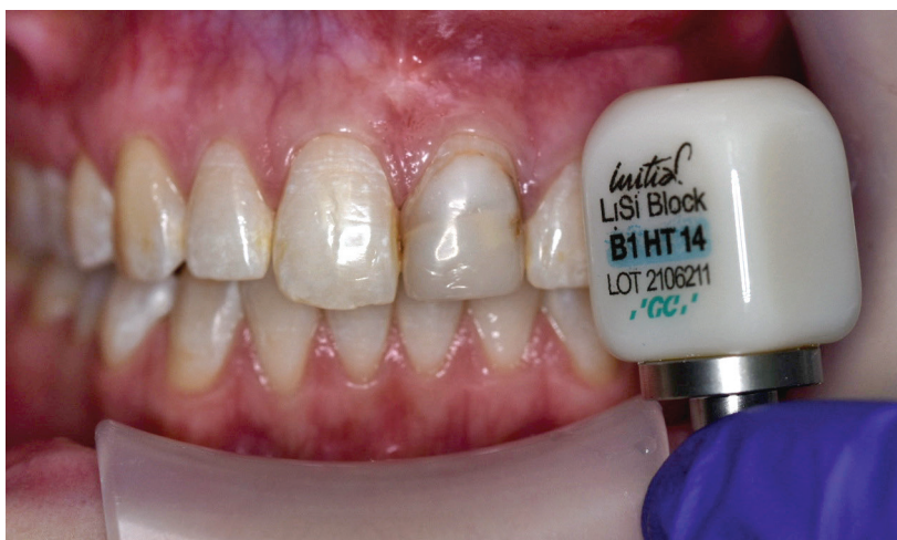
Abb. 2: Material der Wahl: Die vollständig kristallisierte CAD/CAM-Keramik GC Initial LiSi Block.

Soll auf einen Kristallisationsbrand verzichtet werden, war die Werkstoffauswahl bislang beschränkt auf Hybridkeramiken sowie Glaskeramiken. Alternativen waren Hochleistungskomposite, sogenannte Hybridkeramiken. Neu in diesem Umfeld ist nun die erste vollständig kristallisierte Lithium-Disilikat-Keramik Initial LiSi Block (GC). Dieser CAD/CAM-Keramikkblock basiert auf der bewährten HDM-Technologie (High Density Micronization). Die ultrafeinen Kristalle vereinfachen das Schleifen der Keramik, sodass Initial LiSi Block im vollkristallisierten Stadium geschliffen wird. Der Kristallisationsbrand entfällt, was deutlich Zeit einspart. Da kein Kristallisationsbrand notwendig ist, beeindruckten Restaurationen aus Initial LiSi Block selbst bei dünnen Rändern sehr passgenau und weisen eine hohe Kantenstabilität auf. Damit ist es möglich, auch im Frontzahnbereich vollkeramische Restaurationen als harmonisches Pendant zum Nachbarzahn zu fertigen.