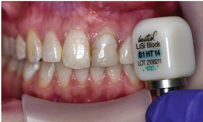
Abb. 2: Material der Wahl: Die vollständig kristallisierte CAD/CAM-Keramik GC Initial LiSi Block.

Soll auf einen Kristallisationsbrand verzichtet werden, war die Werkstoffauswahl bislang beschränkt auf Hybridkeramiken sowie Glaskeramiken. Alternativen waren Hochleistungskomposite, sogenannte Hybridkeramiken. Neu in diesem Umfeld ist nun die erste vollständig kristallisierte Lithium-Disilikat-Keramik Initial LiSi Block (GC). Dieser CAD/CAM-Keramikkblock basiert auf der bewährten HDM-Technologie (High Density Micronization). Die ultrafeinen Kristalle vereinfachen das Schleifen der Keramik, sodass Initial LiSi Block im vollkristallisierten Stadium geschliffen wird. Der Kristallisationsbrand entfällt, was deutlich Zeit einspart. Da kein Kristallisationsbrand notwendig ist, beeindruckten Restaurationen aus Initial LiSi Block selbst bei dünnen Rändern sehr passgenau und weisen eine hohe Kantenstabilität auf. Damit ist es möglich, auch im Frontzahnbereich vollkeramische Restaurationen als harmonisches Pendant zum Nachbarzahn zu fertigen.