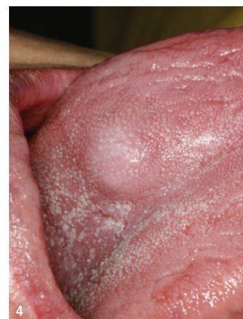
Abb. 2: Verletzung am Gaumen durch harte und kantige Nahrung (Brotkruste). – Abb. 3: Inspektion des Zungenbodens durch Anheben der Zunge. – Abb. 4: Feststellung karziogener Veränderung an der Zunge bei der Zahnreinigung.