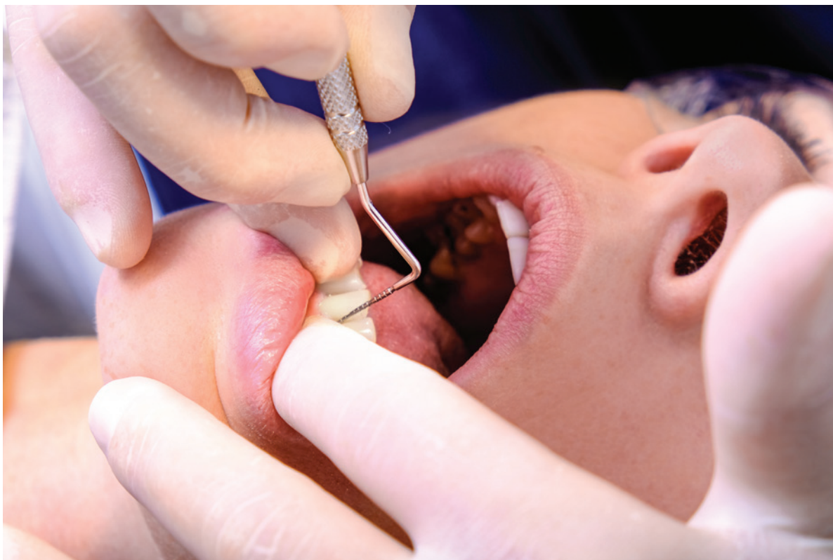
Abb. 5: Befunderhebung mit einer millimeterskalierten PA-Sonde der Indizes.

z. B. auf Basis von Propolis, Aloe vera oder Natron. Stellt der Patient seine Pflegegewohnheiten um, beobachtet die Symptome jedoch weiterhin, meldet er sich ggf. erneut in der Praxis. Die Smartphone-Apps „ToxFox“ und „CodeCheck“ können ihm helfen, beim Produktkauf unerwünschte Inhaltsstoffe zu identifizieren und zu meiden.