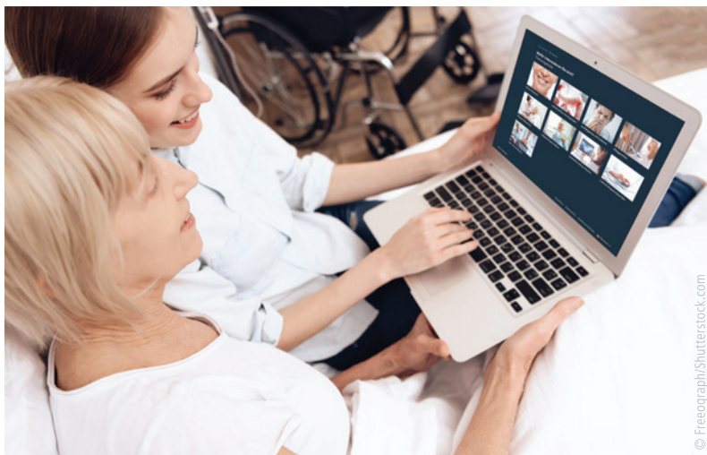
Abb. 1: Mit dem Portal mund-pflege können Pflegekräfte, Angehörige, das zahnärztliche Team und natürlich auch Betroffene selbst von jedem Gerät aus auf umfassende Informationen zur Mundgesundheit bei Menschen mit Pflegebedarf zugreifen.

Die Plattform stellt ein umfassendes Angebot zu relevanten Themen der Mundpflege zur Verfügung. Dazu zählen die