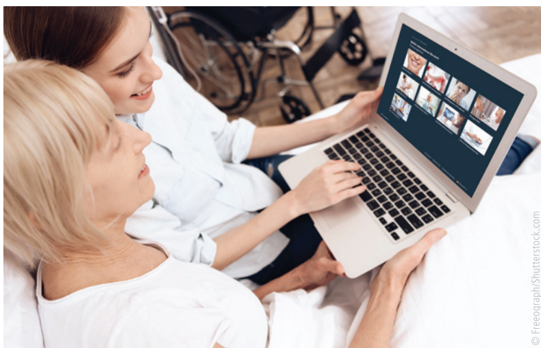
Abb. 1: Mit dem Portal mund-pflege können Pflegekräfte, Angehörige, das zahnärztliche Team und natürlich auch Betroffene selbst von jedem Gerät aus auf umfassende Informationen zur Mundgesundheit bei Menschen mit Pflegebedarf zugreifen.

Die Plattform stellt ein umfassendes Angebot zu relevanten Themen der Mundpflege zur Verfügung. Dazu zählen die