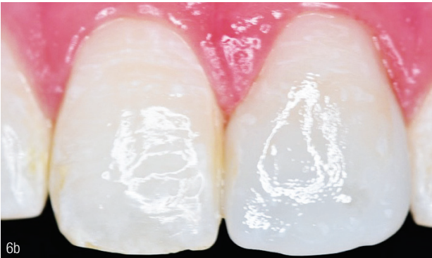
Abb. 4: CAD-Konstruktion der Krone in der Software basierend auf einem automatischen Designvorschlag. Abb. 5: Einprobe der Krone direkt nach dem Schleifen (Kristallisationsbrand nicht erforderlich). Abb. 6a und b: Single Visit: Krone aus GC Initial LiSi Block. Die diffizile Farbstruktur der Nachbarzähne konnte optimal nachgebildet werden. Die Vorher-Nachher-Bilder zeigen das Potenzial: Innerhalb kürzester Zeit und in nur einem Termin konnte die Patientin versorgt werden.

liegendem Fall sollte die Frontzahnkrone zusätzlich den Nachbarzähnen angeglichen werden. Für die Individualisierung wurden die dreidimensionalen Malfarben Initial Lustre Paste L-NFL (GC) verwendet. Mit wenigen Farben konnte die Krone optisch den Nachbarzähnen angepasst, gebrannt und innerhalb kurzer Zeit fertiggestellt werden. Nach dem Anätzen (20 Sekunden mit 5–9% HF) und dem Konditionieren (GC MultiPrimer) der Kroneninnenflächen sowie dem Vorbereiten der Zahnoberfläche erfolgte die adhäsive Befestigung (GC G-CEM ONE, Farbe transluzent). Die Patientin konnte so innerhalb eines Behandlungstermins mit einer vollkeramischen Krone versorgt werden, die sie in ihrer Ästhetik mehr als zufriedenstellte (Abb. 6b).