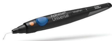
* Die neue Version des VivaPen ermöglicht bis zu dreimal mehr Anwendungen pro ml-Inhalt im Vergleich zu konventionellen Flaschenanwendungen.

Die neue, effiziente Version des VivaPen ermöglicht bis zu dreimal mehr Anwendungen pro ml-Inhalt im Vergleich zu konventionellen Flaschenanwendungen. Die neue Version des VivaPen in Kombination mit Adhese Universal, einem lichterhärtenden Einkomponenten-Adhäsiv für direkte und indirekte Versorgungen und alle Ätztechniken, ermöglicht einzigartiges und effi-