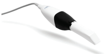
* VivaScan ist eine kompakte und intuitive Lösung für Zahnärzte, die in die Welt der digitalen Zahnheilkunde einsteigen möchten.

Mit einem Intraoralscanner können Zahnärzte schnell, einfach und mühelos digitale Abdrücke von den Zähnen ihrer Patienten nehmen. Im Vergleich zur konventionellen Abdrucknahme ist die digitale Abformung deutlich zeitsparender und angenehmer für den Patienten. Darüber hinaus erhält der Patient einen interes-