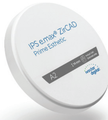
* IPS e.max ZirCAD Prime Esthetic Scheibe.

Das neue IPS e.max ZirCAD Prime Esthetic gehört zur Familie des bewährten IPS e.max