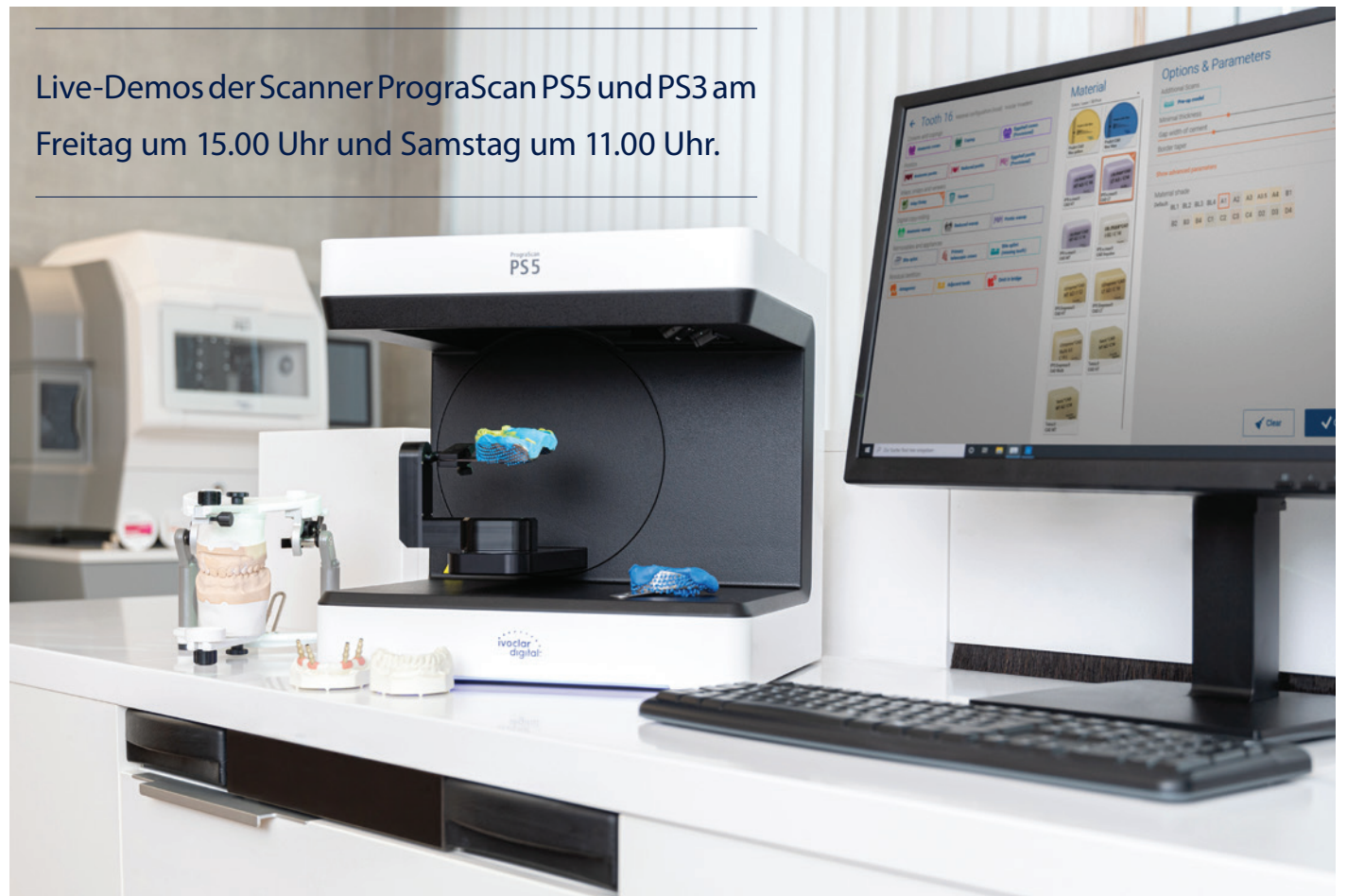
Live-Demos der Scanner PrograScan PS5 und PS3 am Freitag um 15.00 Uhr und Samstag um 11.00 Uhr.