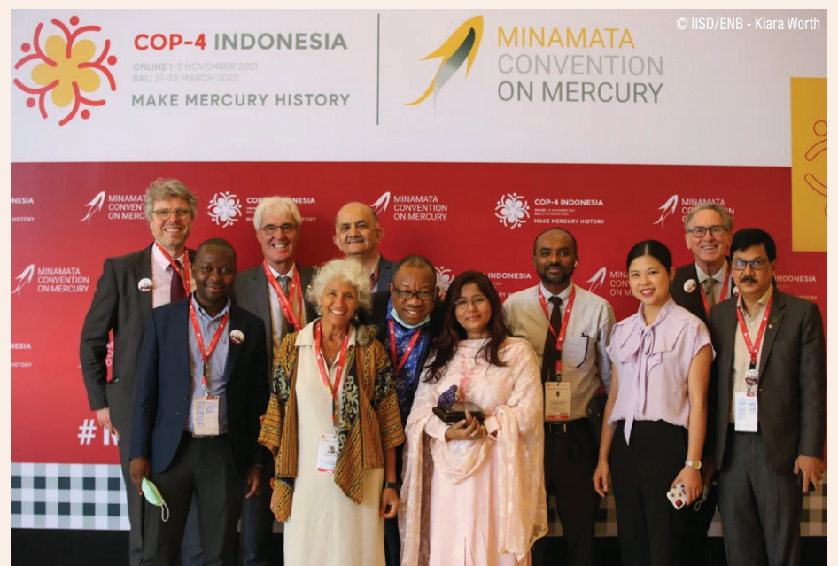
World Alliance for Mercury-Free Dentistry.