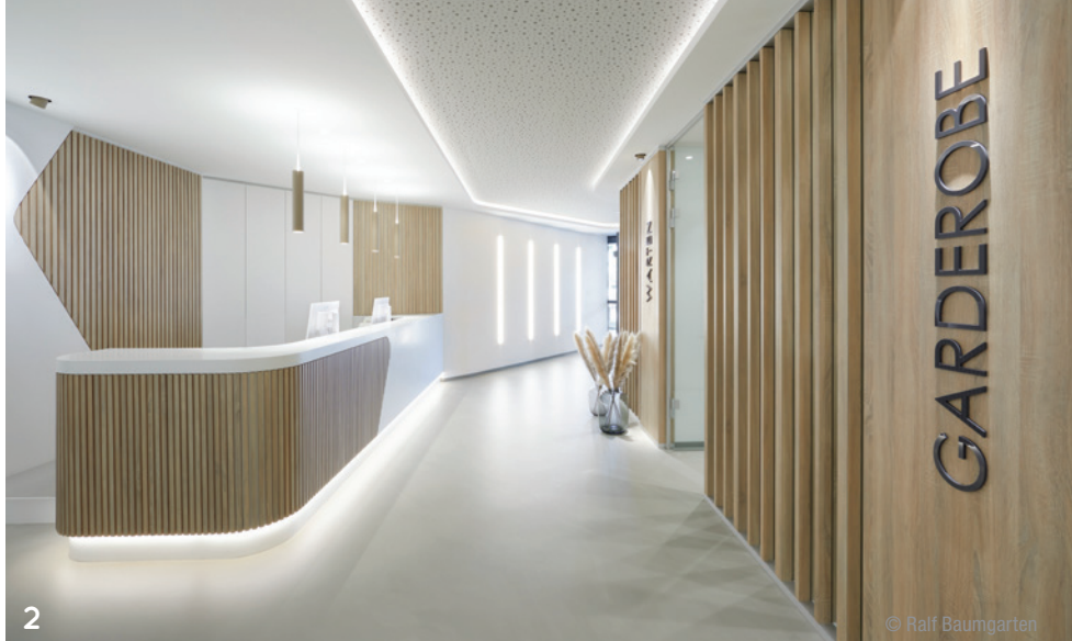
Abb. 1: Innovatives Design im Factory Ambiente in der Beos AG, Köln. Abb. 2: Materialien, die sich verstehen – klare Formensprache in Holz und Beton in der Praxis „M71 Zahnärzte am Markt“, Sankt Augustin.

Die Antwort ist ein ganz klares JA! Eine hohe gestalterische Qualität der Räumlichkeiten vermittelt eine hohe Qualität der fachspezifischen Dienstleistungen, das Selbstverständnis, die Zielsetzung und die Leistungsfähigkeit der Praxis. Der (Zahn-)Arzt hat über das Praxisdesign