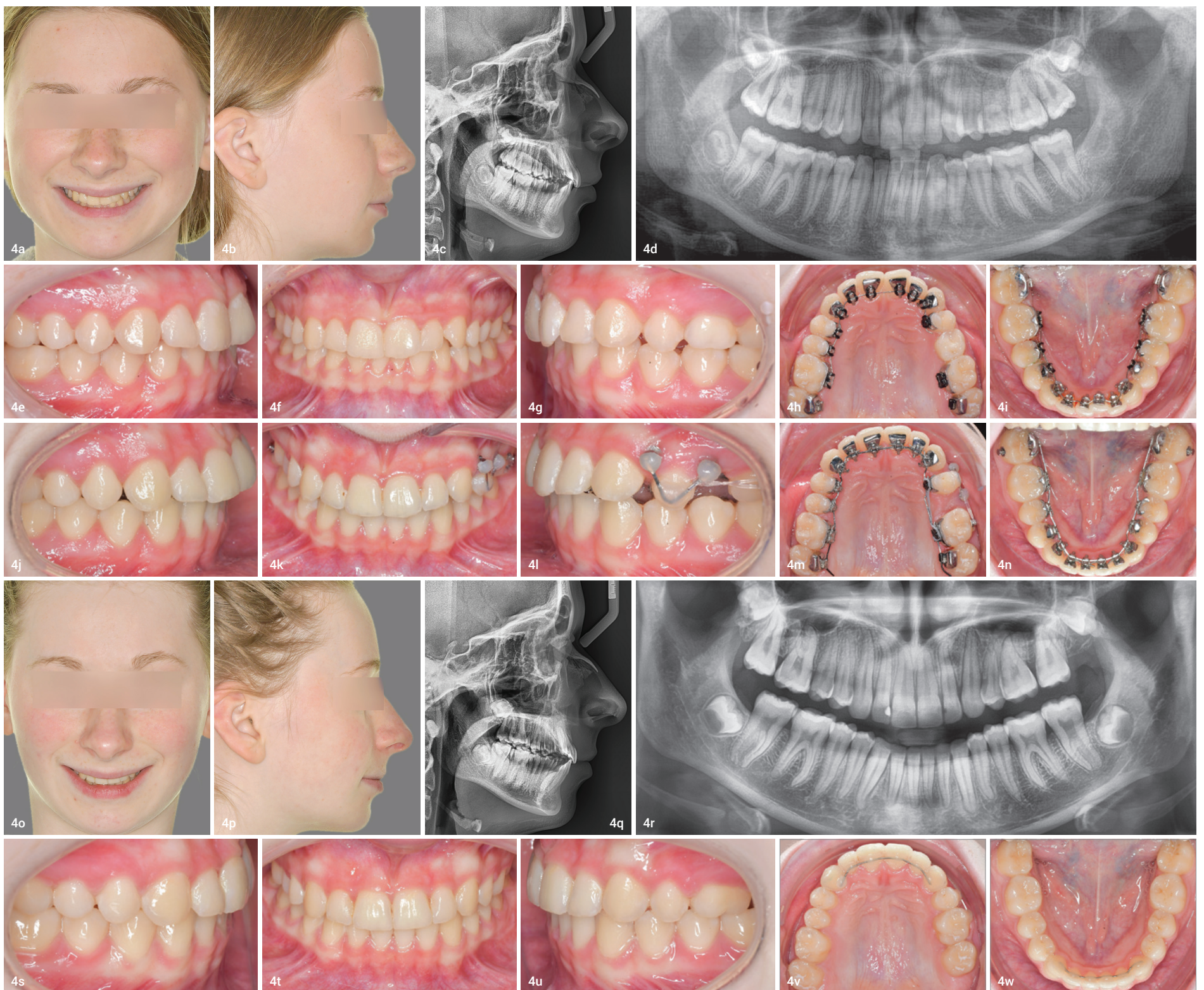
Abb. 4a–i: 14-jährige Patientin mit Nichtanlage Regio 25 und linksseitiger Klasse II-Verzahnung mit Abweichung der Unterkiefermitte. Außerdem bestand ein frontal tiefer Biss. Zur linksseitigen Molarenmesialisierung wurde eine vollständig individuelle linguale Apparatur eingesetzt. Zur Reduzierung der Friktion wurden die Oberkieferseitenzahnbrackets auf der linken Seite DLC-beschichtet. Abb. 4j–n: Nach der Ausformung begann der Lückenschluss von distal am linksseitig geraden .016" x .024" Stahlbogen. Da in diesem Fall zur Korrektur der Klasse II links auch intermaxilläre Klasse II-Gummizüge eingesetzt werden sollten, wurde der Zahn 24 mit zwei Minischrauben und einem Teilbogen verblockt. Die Gummiketten zogen nicht direkt zu den Minischrauben, sondern wurden als Doppelkabel am Zahn 24 befestigt (indirekte Mechanik). Abb. 4o–w: Am Behandlungsende ist ein kompletter körperlicher Lückenschluss zu erkennen. Die Ober- und die Unterkiefermitte stimmen mit der Gesichtsmitte überein. Bis zum Durchbruch des Zahnes 28 sind 24 und 26 mit einem Teilretainer verblockt (Abb. 4v). Die Gesamtsituation ist prognostisch günstig, auch weil auf jegliche Art von Zahnersatz verzichtet wurde.