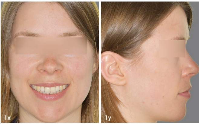
Abb. 1x–dd: Zwölf Jahre nach dem Abschluss der festsitzenden kieferorthopädischen Behandlung werden die Vorteile der kieferorthopädischen Lösung zunehmend deutlich. Der Weisheitszahn im zweiten Quadranten hat sich eingestellt und komplettiert die Zahnreihe im Oberkiefer. In der Aufsicht erkennt man im Seitenvergleich spiegelbildähnliche Verhältnisse. Die Seitenverzahnung ist nach wie vor exzellent.