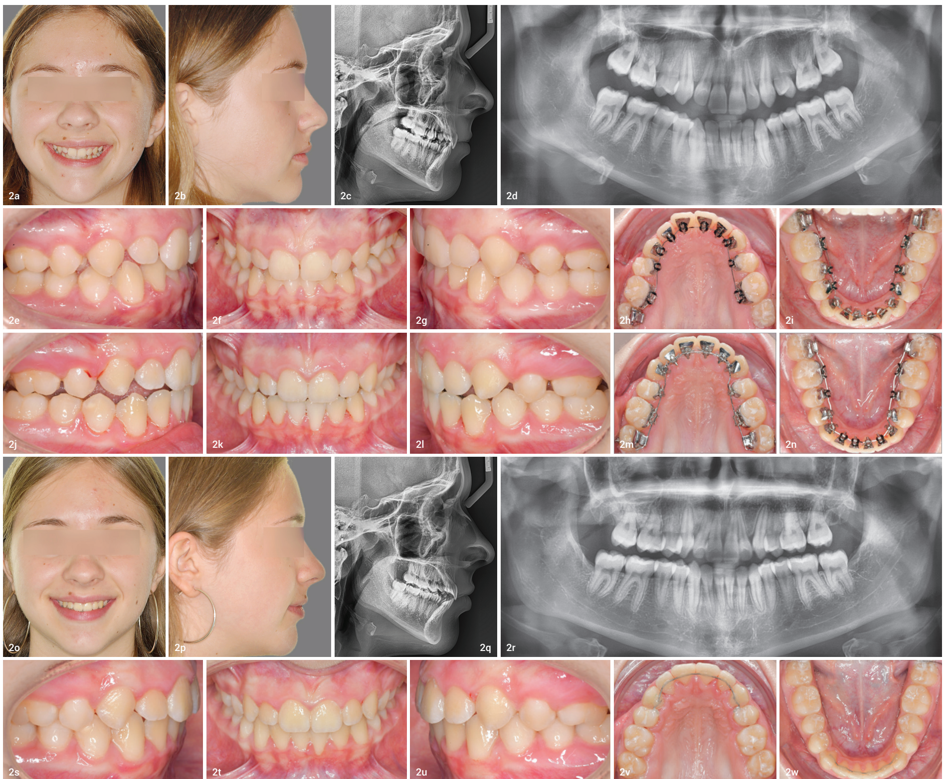
Abb. 2a–i: 14-jährige Patientin mit beidseits nicht angelegten oberen zweiten Prämolaren. Aufgrund der frühzeitigen Entfernung der Milchmolaren ist es zu einer bilateralen Aufwanderung gekommen. Unglücklicherweise hatte der Kieferchirurg nicht nur die vom Kieferorthopäden angewiesenen zweiten Milchmolaren im Oberkiefer entfernt, sondern zusätzlich auch noch die Weisheitszähne im selben Kiefer. Abb. 2j–n: Nach der Ausformung begann der Restlückenschluss mit Gummiketten am seitlich geraden .016" x .024" Stahlbogen. Unterstützend wurden zudem intermaxilläre Klasse III-Gummizüge eingesetzt. Der palatale Wurzelortorque im Oberkiefer sowie der linguale Wurzelortorque im Unterkiefer wurden mit Extratorque-Biegungen im anterioren Bereich der Stahlbögen (3-3) durchgeführt. Gerade in dieser Phase sind körperliche Zahnbewegungen notwendig, um ein qualitativ hochwertiges Behandlungsergebnis zu erzielen. Abb. 2o–w: Am Ende der aktiven Behandlung mit festsitzenden kieferorthopädischen Apparaturen waren die Behandlungsziele erreicht. Zu erkennen ist ein körperlicher Lückenschluss im Bereich der Nichtanlagen. Durch die kontrollierten Torquebewegungen im anterioren Bereich konnte ein normwertiger Interinziswinkel eingestellt werden. Die Seitenverzahnung am Tag der Entfernung der vollständig individuellen lingualen Apparatur ist exzellent!

mangel im Ober- und Unterkiefer mit frontal knappem vertikalen Überbiss. Die kieferorthopädische Behandlung wurde mit einer vollständig