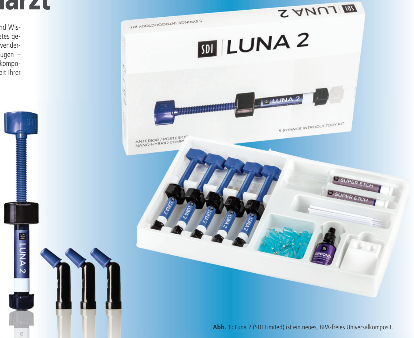
Abb. 1: Luna 2 (SDI Limited) ist ein neues, BPA-freies Universalkomposit.