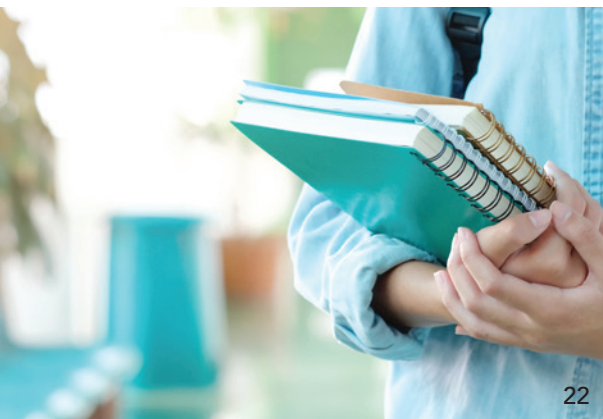
Ab 1. August 2022 gilt eine neue Ausbildungsverordnung für ZFA.