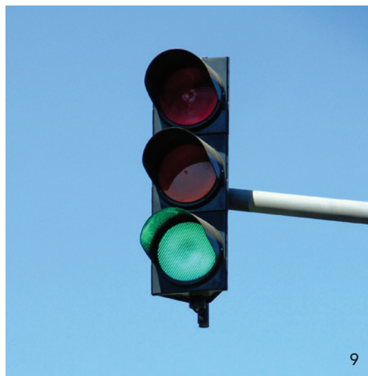
Auf Grün steht jetzt die Ampel bei der PAR-Therapie für Privatpatienten.