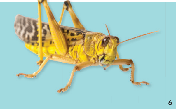
Immer mehr MVZ drängen auf den Markt.