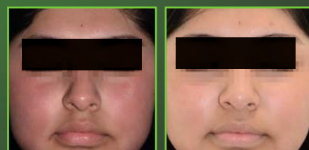
Vor & nach 1er Behandlung