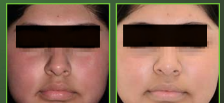
Vor & nach 1er Behandlung