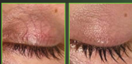
Vor & nach 2 Behandlungen: CoolView & Genesis V 532 nm

HÖCHSTE PRÄZISION MIT DEM 1-2MM DERMASTAT- HANDSTÜCK