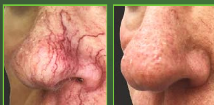
Vor & nach 2 Behandlungen: Dermastat 532 nm