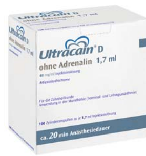
Ultracain® D ohne Adrenalin

Ultracain D-S 1:200.000 1,7 ml/2 ml/20 ml, 40 mg/ml/0,006 mg/ml Injektionslösung; Ultracain D-S forte 1:100.000 1,7 ml/2 ml/20 ml, 40 mg/ml/0,012 mg/ml Injektionslösung; Ultracain D ohne Adrenalin 1,7 ml/2 ml, 40 mg/ml Injektionslösung