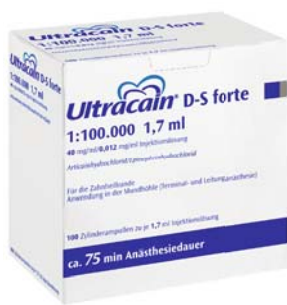
Ultracain® D-S forte 1:100.000

Ultracain® – weil jeder Patient besonders ist