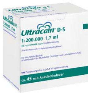
Ultracain® D-S 1:200.000