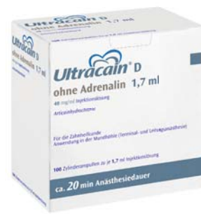
Ultracain® D ohne Adrenalin

Ultracain D-S 1:200.000 1,7 ml/2 ml/20 ml, 40 mg/ml/0,006 mg/ml Injektionslösung; Ultracain D-S forte 1:100.000 1,7 ml/2 ml/20 ml, 40 mg/ml/0,012 mg/ml Injektionslösung; Ultracain D ohne Adrenalin 1,7 ml/2 ml, 40 mg/ml Injektionslösung