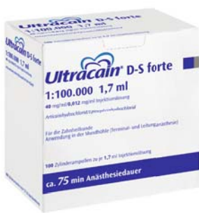
Ultracain® D-S forte 1:100.000

Ultracain® – weil jeder Patient besonders ist