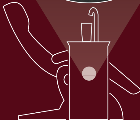
Sicherungseinrichtung „Freie Fallstrecke“ nach DIN EN 1717