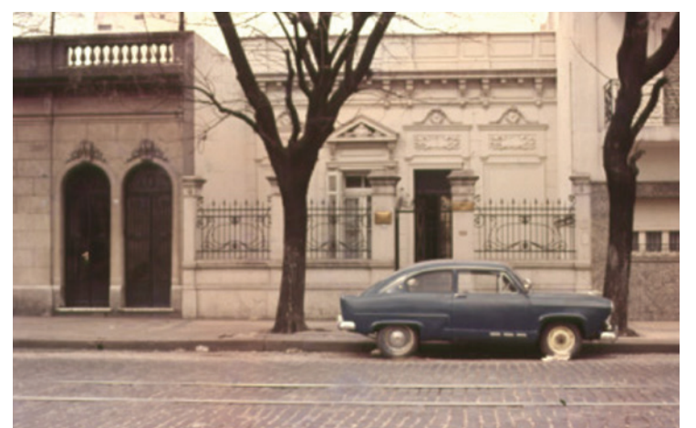
Buenos Aires 1965, Sitz der AAOFM.